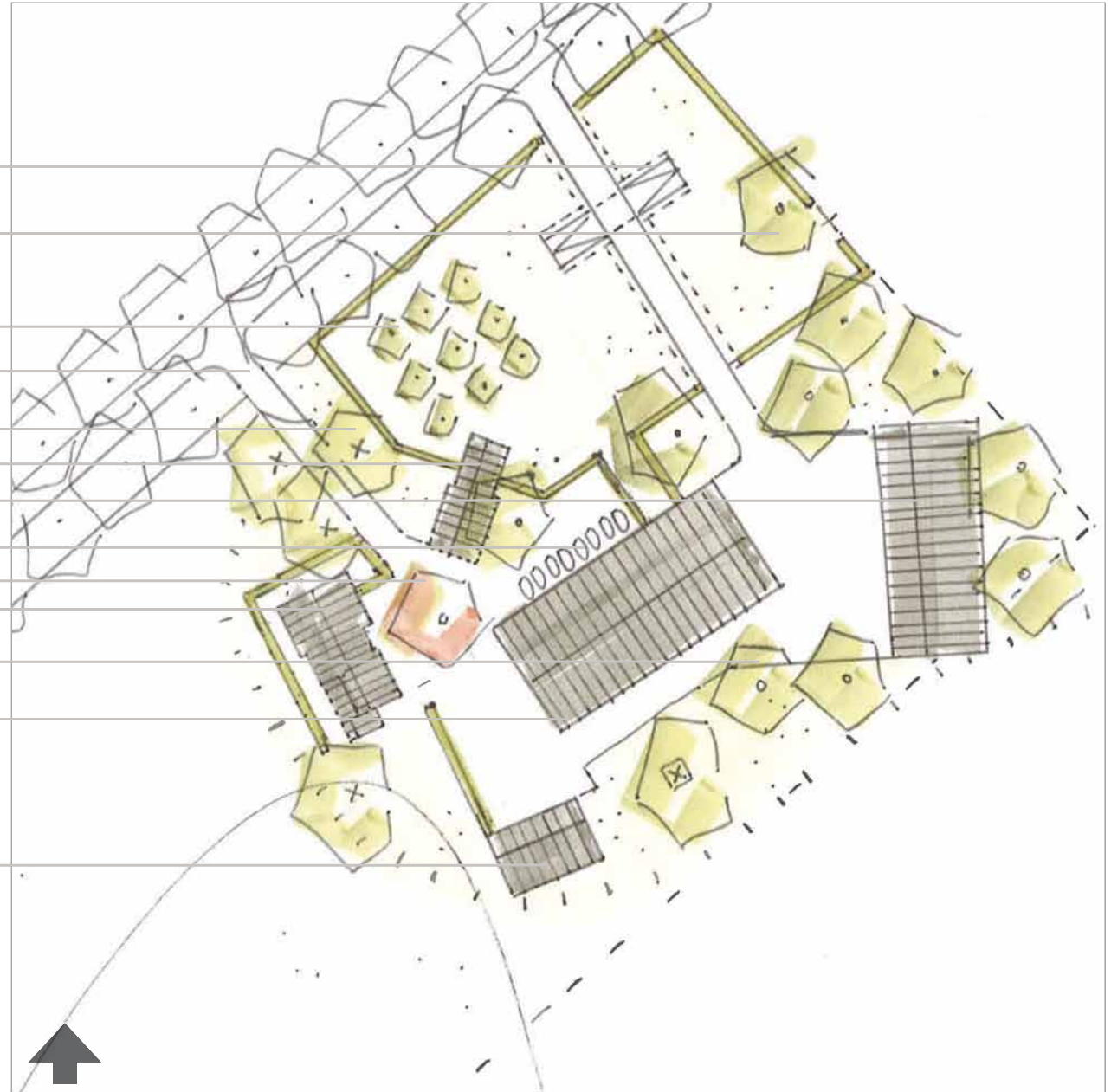
Erfstructuurplan schaal 1:1000

Ruimte reserveren voor toekomstig; nieuw 'zorggebouw' t.b.v dagbesteding; uitzicht vanuit gebouw op weilanden langs de Molengoot