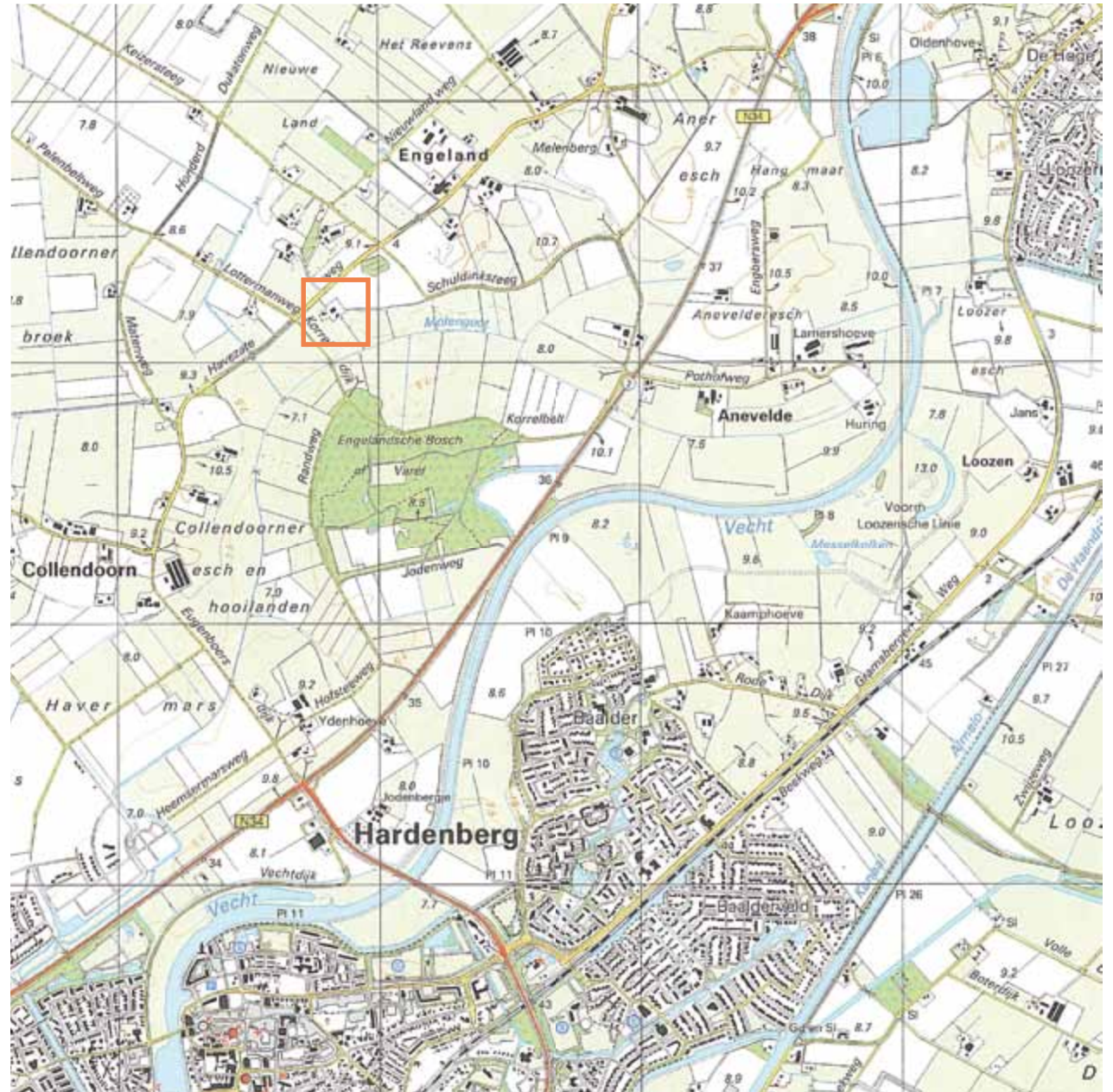
Locatie plangebied op topografische kaart schaal 1:25000 (uitgave 2006)