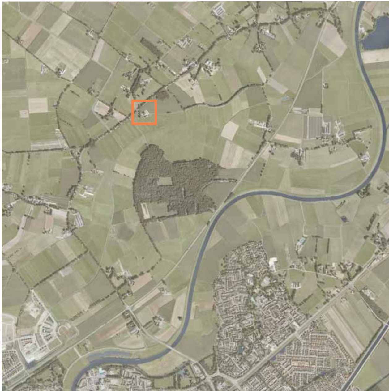
Plangebied op luchtfoto