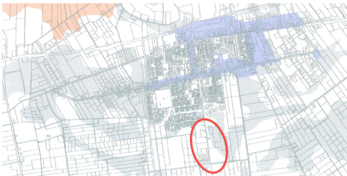
Uitsnede gemeentelijke archeologische beleidskaart gemeente Hardenberg