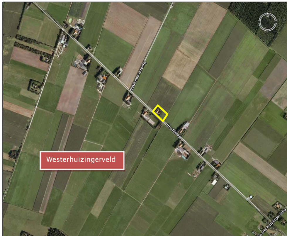
Figuur 1: Kaart met de situering van het plangebied (geel omlijnd) aan de Hoofdweg in het Westerhuizingerveld.

De beoogde plannen op de locatie bestaan uit de realisatie diverse speelvoorzieningen voor kinderen, waaronder een kinderboerderij, speeltoestellen en speelweiden. Daarnaast wordt een groot deel van het terrein verhard en worden een aantal parkeerplaatsen aangelegd. De boerderij met schuur en de meeste beplanting blijft behouden.