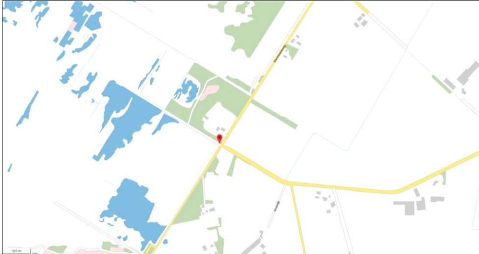
Globale ligging van het plangebied. De ligging van het plangebied wordt met de rode marker aangeduid.

Het plangebied is gesitueerd aan de Wennewickweg 8 te Buurse. Het ligt in het buitengebied, circa 4,3 kilometer ten zuidoosten van de woonkern Haaksbergen. Het grenst aan de westzijde aan het Haaksbergerveen en aan de overige zijden aan landelijk gebied. Op onderstaande afbeelding wordt de globale ligging van het plangebied weergegeven op een topografische kaart.