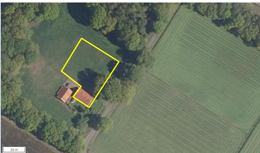
Begrenzing van het plangebied; deze wordt met de gele lijn aangeduid.

Het plangebied vormt een deel van een bestaand woonerf en bestaat uit bebouwing en extensief beheerd grasland. In het plangebied staat een vrijstaande woning. Deze woning beschikt over bakstenen buitengevels en is voorzien van een zadeldak met dakpannen. De staat van onderhoud van de woning is goed; het gebouw is wind- en waterdicht. Het grasland bestaat uit een soortenarme vegetatie die vrij intensief wordt beheerd (maaien en afvoeren maaisel). Op onderstaande afbeelding wordt de begrenzing van het plangebied weergegeven. Voor een verbeelding van de huidige situatie wordt verwezen naar de fotobijlage.