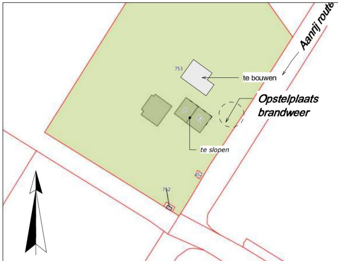
Plattegrond van het erf na planrealisatie

Het voornemen bestaat om de woonboerderij te slopen en een nieuwe woning te bouwen, iets ten noorden van de huidige bouwplaats. De schuur blijft behouden. Op onderstaande afbeelding wordt een plattegrond van het wenselijke eindbeeld weergegeven.