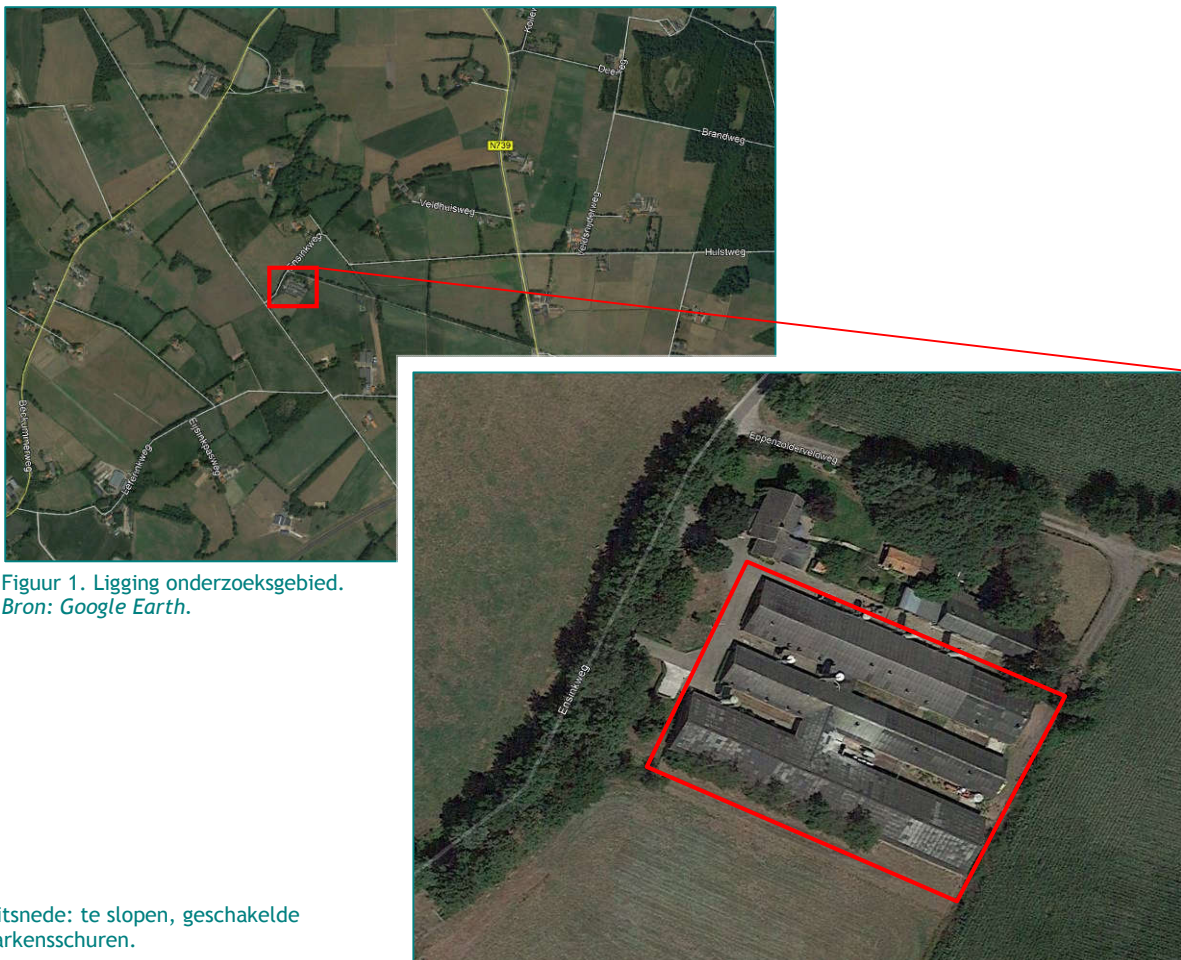
Figuur 1. Ligging onderzoeksgebied.

Uitsnede: te slopen, geschakelde varkensschuren.