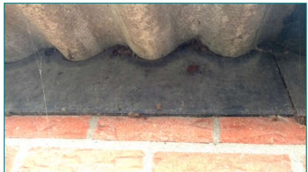
Foto 1: Tongvaren in de voegen onder een lekkend dak. Foto 2: Afdichtingsprofielen onder golfplaten.