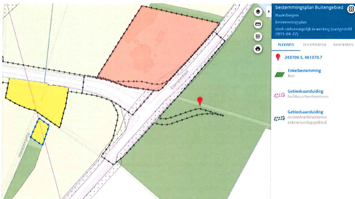
Afbeelding 2: ligging Assinkweg in de Enkelbestemming 'Bos' (rode pion)

De N315, Eibergsestraat en de aansluiting van beide wegen (kruispunt) hebben een verkeersbestemming. Binnen deze bestemming is het toegestaan het kruispunt aan te passen in een rotonde. De geplande rotonde past echter niet geheel binnen het bestemmingsvlak 'Verkeer' en om dit mogelijk te maken dient het bestemmingsvlak voor verkeer vergroot te worden. De Assinkweg wordt gedeeltelijk verplaatst waardoor deze aansluit op de nieuwe rotonde. De Assinkweg ligt in de bestemming 'Bos'. Het gebruik van deze gronden voor het verleggen van de Assinkweg is op dit moment strijdig met de regels van het bestemmingsplan. Dit bestemmingsplan voorziet in het oplossen van deze planologische strijdigheid. Zie afbeelding 2 voor de ligging van de Assinkweg in de bestemming 'Bos'.