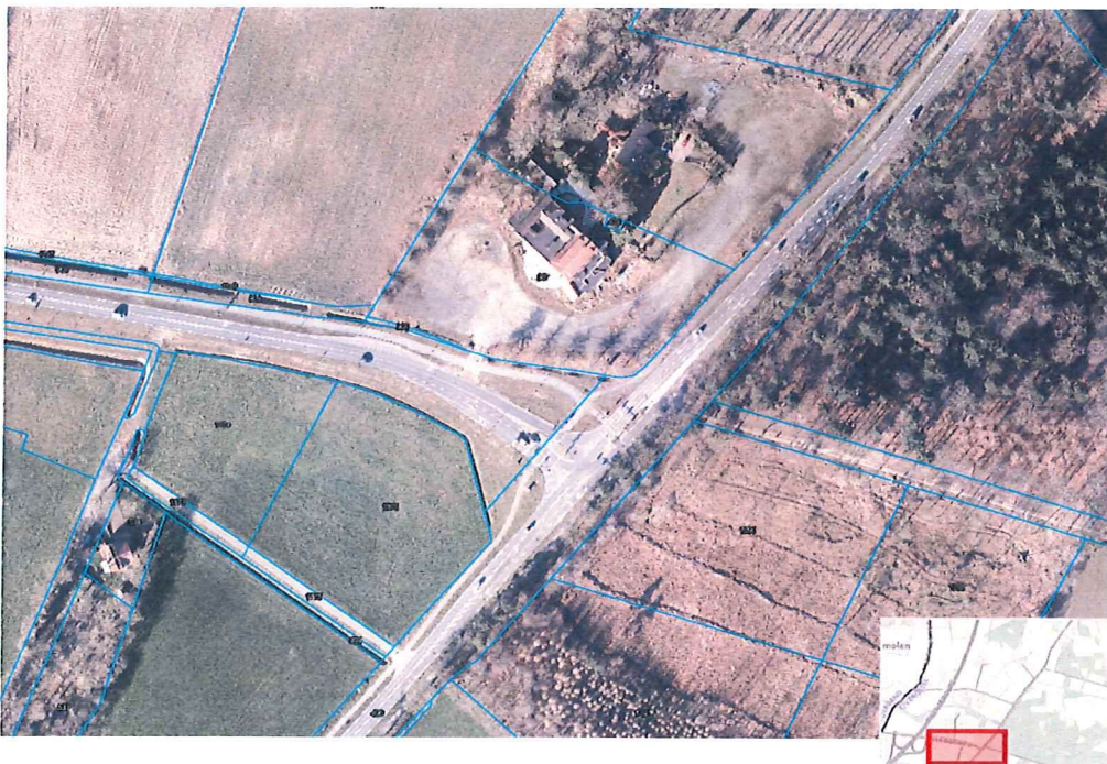
Afbeelding 1: kruispunt nabij voormalig Danspaleis.

Het plan omvat het herinrichten van de aansluiting N315 met de Eibergsestraat/N768 (kruispunt nabij voormalig Danspaleis). Zie afbeelding 1 voor de ligging van het huidige kruispunt. De provincie Overijssel wordt de nieuwe wegbeheerder van een gedeelte van de oude N18 (momenteel bekend als Eibergsestraat). Rijkswaterstaat is momenteel nog de wegbeheerder van deze weg. De oude N18 wordt na de overdracht omgenummerd tot de N768. Door de aanleg van de nieuwe N18 maakt minder verkeer gebruik van de oude N18. Het aanwezige verkeerslicht op de aansluiting van de N315 (reeds in beheer van provincie Overijssel) is toe aan vervanging. Naar aanleiding hiervan is onderzoek gedaan naar een verkeersveilige en passende herinrichting van het kruispunt en zijn er verschillende varianten onderzocht. Uit onderzoek blijkt dat een (enkelstrooks) rotonde de beste optie is.