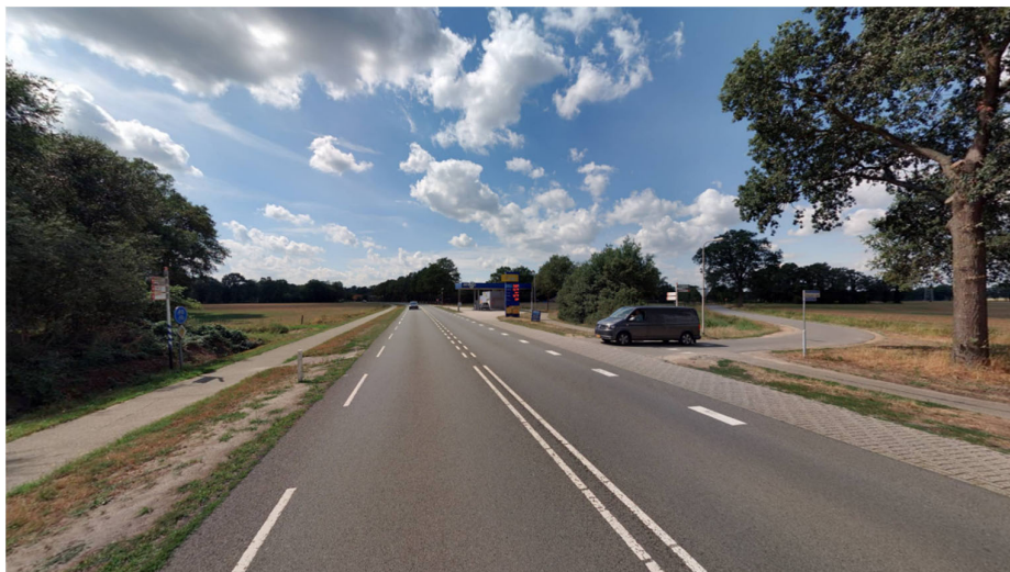
Figuur 2.4: Eibergsestraat met rechts de Kerkweg