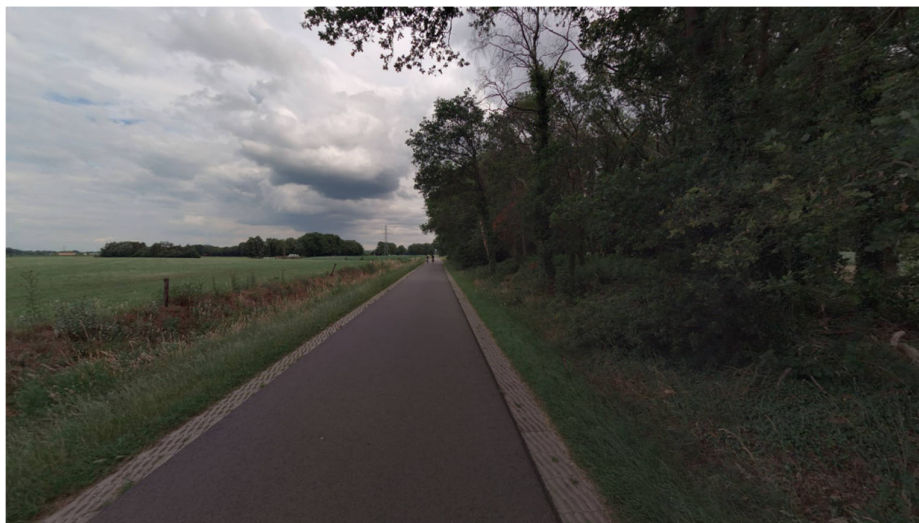
Figuur 6.3: De Kerkweg ter hoogte van Landgoed Harink

Vertrekkende bezoekers maken gebruik van de bestaande (nu nog onverharde) verbinding naar de Kerkweg. De Kerkweg is een smalle 60 km/h-weg zonder doorgaande functie voor het autoverkeer. Auto's die elkaar hier tegenkomen, moeten beide uitwijken naar de verharde berm. Het verkeer gerelateerd aan de uitvaartonderneming kan hier gezien de beperkte omvang van dit verkeer goed afgewikkeld worden.