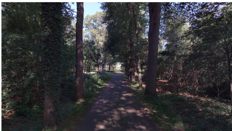
Figuur 6.2: De oprijlaan tot Landgoed Harink

In verband met de zichtbeperking door de bebouwing op de hoek is het goed dat deze ontsluiting door de bezoekers alleen als inrit wordt gebruikt. Dit past ook bij de breedte van de oprijlaan, tegemoetkomend autoverkeer kan elkaar niet passeren tussen de bomen.