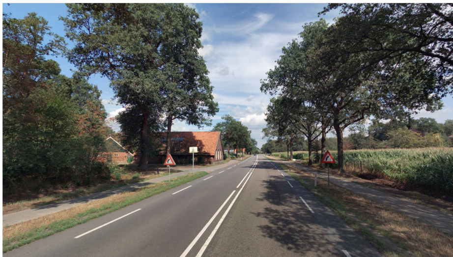
Figuur 6.1: Links de inrit naar het terrein vanaf de Eibergsestraat

In verband met de zichtbeperking door de bebouwing op de hoek is het goed dat deze ontsluiting door de bezoekers alleen als inrit wordt gebruikt. Dit past ook bij de breedte van de oprijlaan, tegemoetkomend autoverkeer kan elkaar niet passeren tussen de bomen.