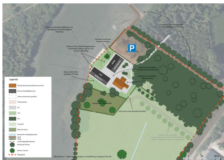
Figuur 5.1: Kaart van Landgoed Harink met de parkeerlocatie

Langs de toegangsweg is er geen ruimte om te parkeren, maar op het terrein is er voldoende ruimte voor de 30 benodigde parkeerplaatsen. In het plan wordt uitgegaan van een parkeerterrein in halfverharding. Rond de gebouwen is voldoende ruimte aanwezig om ook een paar invalidenparkeerplaatsen te realiseren.