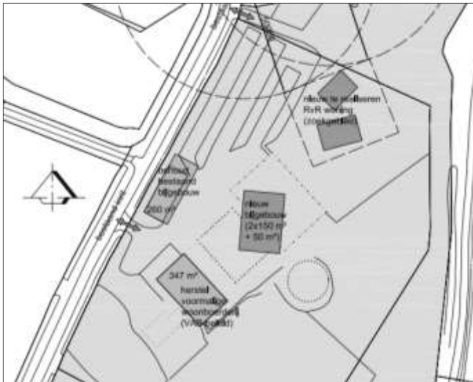
Verbeelding van het wenselijk eindbeeld (bron: Focus Architectuur).

Het voornemen is een extra woning op het erf te bouwen. Ter compensatie voor deze extra woning, wordt overtollige bebouwing op het erf gesloopt. De huidige bedrijfswoning wordt gesloopt en de voormalige boerderij op het erf wordt geschikt gemaakt voor bewoning. Op het erf wordt een extra bijgebouw opgericht. De bestaande erfverharding wordt grotendeels verwijderd. Het erf wordt nadien landschappelijk ingepast door middel van de aanplant van erfbeplanting. Op onderstaande afbeelding wordt een plattegrond van het wenselijk eindbeeld weergegeven.