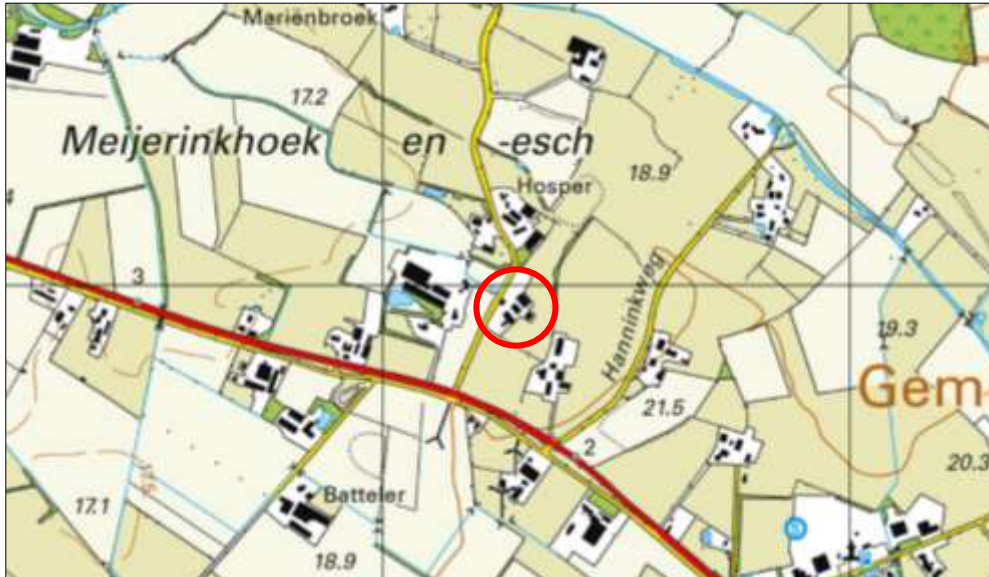
Globale ligging van het plangebied. De ligging van het plangebied wordt met de rode cirkel aangeduid.

Het plangebied is gesitueerd aan de Benteloseweg 6 te Haaksbergen. Het ligt circa 2,5 kilometer ten noordwesten van de woonkern van Haaksbergen en wordt omgeven door landelijk gebied. Op onderstaande afbeelding wordt de globale ligging van het plangebied weergegeven op een topografische kaart.