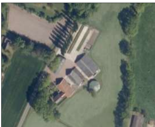
detailopname van het plangebied.

Het plangebied vormt een agrarisch erf, waar de agrarische activiteiten al enige tijd geleden gestaakt zijn. In het plangebied staan een bedrijfswoning, stal, ligboxenstal, oude boerderij, mestilo en een schuur. Aan de noordzijde van het erf ligt erfverharding welke gebruikt werd als kuilvoerplaat. De gebouwen beschikken allemaal over gemetselde buitengevels. De ligboxenstal en de stal aan de westzijde zijn gedekt met golfplaten, de overige gebouwen zijn gedekt met dakpannen. De staat van onderhoud van de gebouwen is goed, alle gebouwen zijn wind- en waterdicht. Aan de voorzijde van de bedrijfswoning ligt een eenvoudige siertuin met gazon, heesters en sierplanten. Het erf grenst aan de westzijde aan openbare weg en grenst aan de overige zijden aan intensief beheerd agrarisch cultuurland.