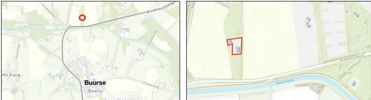
Figuur 2.1 Ligging projectgebied ten opzichte van de kern Buurse

Het projectgebied is gelegen aan de Broekheurnerweg 27a -Z, in het buitengebied van Haaksbergen. Het perceel bevindt zich nabij de Buurser Beek, op korte afstand van de kern Buurse en staat kadastraal bekend als gemeente Haaksbergen, sectie R, nummer 211. In figuur 2.1 is de ligging van het projectgebied indicatief ten opzichte van de kern Buurse en de directe omgeving weergegeven middels de rode omlijning.