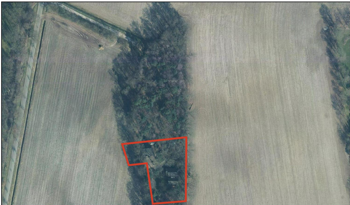
Figuur 2.2 Ligging perceel ten opzichte van de directe omgeving

In het projectgebied bevindt zich een recreatiewoning met één vrijstaand bijgebouw. De grond rondom de recreatiewoning is voornamelijk in gebruik als tuin of verhard. In figuur 2.2 is een luchtfoto met daarin de huidige situatie op het perceel opgenomen. Het projectgebied is hierbij wederom indicatief aangegeven middels de rode omlijning.