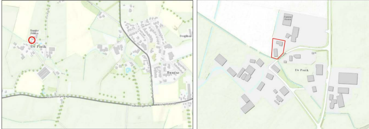
Figuur 2.1 Ligging plandeel ten opzichte van de kern Buurse

Het plandeel is gelegen aan de Porikweg 13 –Z, in het buitengebied van Haaksbergen. Het perceel bevindt zich nabij de Buurser Beek, op korte afstand van de kern Buurse en staat kadastraal bekend als gemeente Haaksbergen, sectie R, nummer 58. In figuur 2.1 is de ligging van het plandeel indicatief ten opzichte van de kern Buurse en de directe omgeving weergegeven middels de rode omlijning.