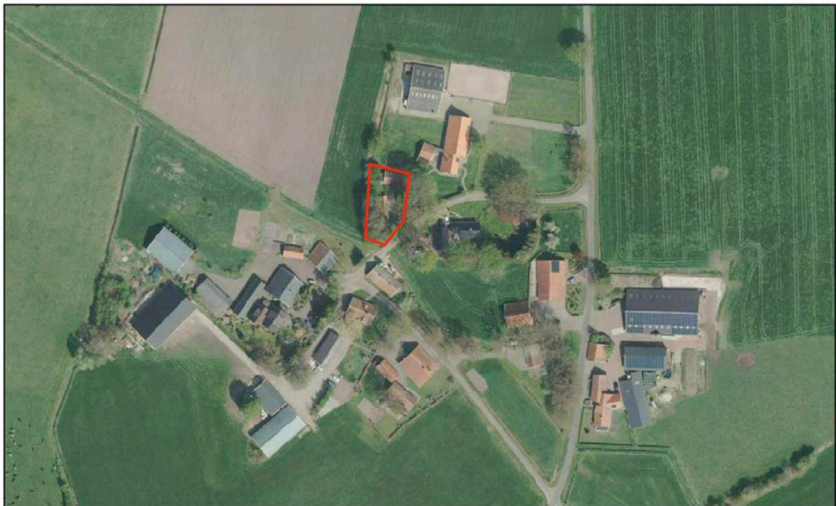
Figuur 2.2 Ligging perceel ten opzichte van de directe omgeving

In het plandeel bevinden zich een reguliere woning en één vrijstaand bijgebouw. De grond rondom de woning is voornamelijk in gebruik als tuin of verhard. In figuur 2.2 is een luchtfoto met daarin de huidige situatie op het perceel opgenomen. Het plandeel is hierbij wederom indicatief aangegeven middels de rode omlijning.