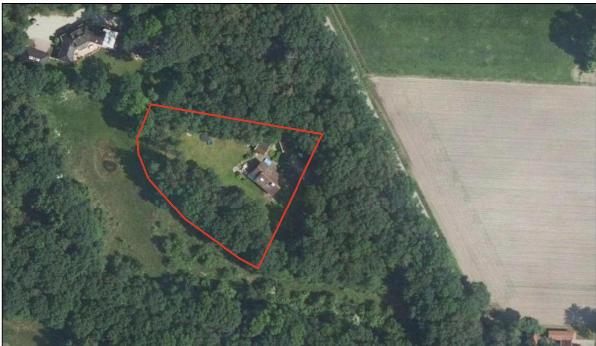
Figuur 2.2 Ligging perceel ten opzichte van de directe omgeving

In het projectgebied bevinden zich een recreatiewoning en een drietal bijgebouwen. De grond rondom de recreatiewoning is voornamelijk in gebruik als tuin of verhard. In figuur 2.2 is een luchtfoto met daarin de huidige situatie op het perceel opgenomen. Het projectgebied is hierbij wederom indicatief aangegeven middels de rode omlijning.