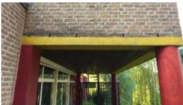
Open stootvoegen in de buitengevel van één van de gebouwen.

Er zijn tijdens het veldbezoek geen vleermuizen waargenomen en er zijn geen aanwijzingen gevonden dat vleermuizen een rust- of voortplantingsplaats in het plangebied bezetten. De gebouwen beschikken echter over gemetselde buitengevels met luchtsponw, en er zijn verschillende potentiële invliegopeningen waargenomen, die vleermuizen in staat stellen een verblijfplaats te bezetten in de luchtsponw. Zo zijn open stootvoegen waargenomen en kan een kier tussen de daklijst van het platte dak en de buitengevel niet uitgesloten worden. Verder zijn in het plangebied geen potentiële verblijfplaatsen van vleermuizen waargenomen, zoals een holle ruimte achter een boeiboord, windveer, loodslab, vensterluik, zonnewering of gevelbetimmering aangetroffen. Ook zijn geen potentiële verblijfplaatsen waargenomen in bomen.