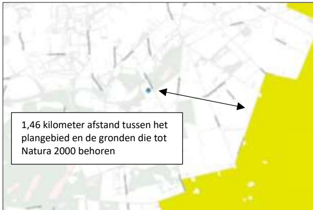
Ligging van Natura 2000-gebied in de omgeving van het plangebied. De ligging van het plangebied wordt met de blauwe marker aangeduid. Gronden die tot Natura 2000 behoren worden met de okergele kleur aangeduid.