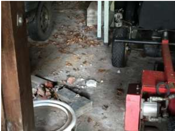
Huisspitsmuizen en bosmuizen kunnen een rust- en voortplantingsplaats bezetten in voertuigen in de schuren

voortplantingsplaats voor grondgebonden zoogdieren. Een geschikte plek voor egel en steenmarter om een vaste rust- of voortplantingsplaats te bezetten, ontbreekt in het plangebied.