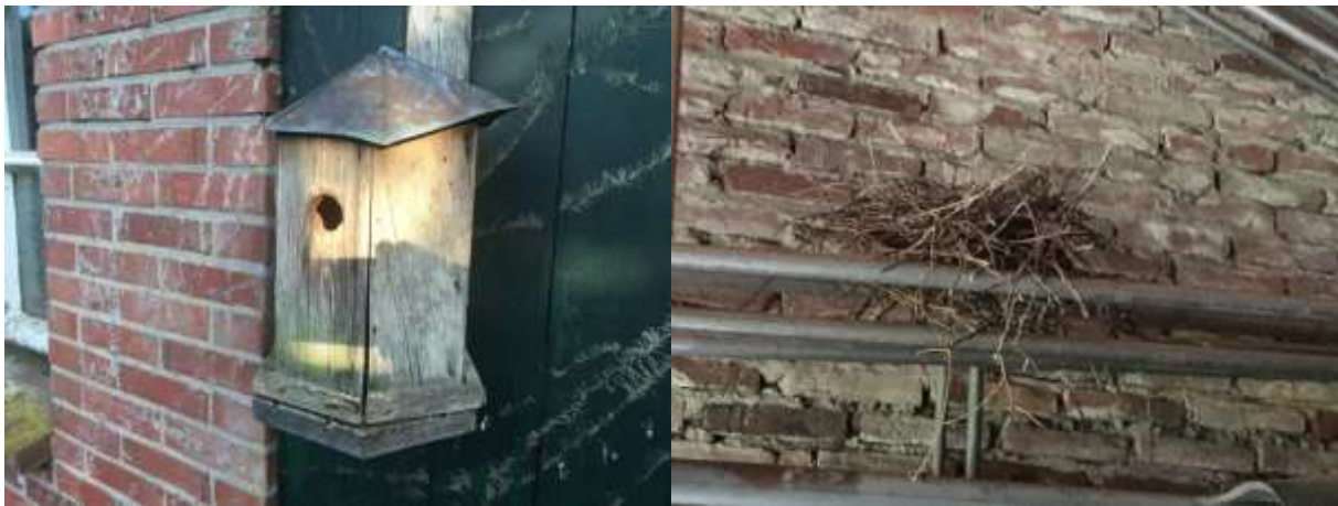
Foto links; Nestkast voor pimpelmees en koolmees. Foto rechts; oud houtduivenest van in één van de te slopen schuren.

Het plangebied behoort tot functioneel leefgebied van verschillende vogelsoorten. Vogels benutten het plangebied als foerageergebied en vermoedelijk nestelen er jaarlijks vogels in het plangebied. Vogels kunnen nestelen in de beplanting, nestkast en de toegankelijke bebouwing. Vogelsoorten die mogelijk in het plangebied nestelen zijn merel, houtduif, roodborst, winterkoning, zwartkop, pimpelmees, koolmees, Turkse tortel, vink en tijtjaf. De garage, de overkapping met houtopslag en de twee schuren zijn toegankelijk voor vogels waardoor deze bebouwing kan dienen als nestlocatie. In het plangebied zijn geen aanwijzingen gevonden dat huismussen er een rust- of voortplantingsplaats bezetten. Tevens zijn geen aanwijzingen gevonden dat steen- of kerkuil er een vaste rust- of nestplaats bezetten. Aanwezigheid van deze soorten in gebouwen is doorgaans gemakkelijk vast te stellen aan de hand van braakballen, schijtsporen en ruiveren. Er zijn ook geen aanwijzingen dat roofvogels een vaste rust- of nestplaats in het plangebied bezetten.