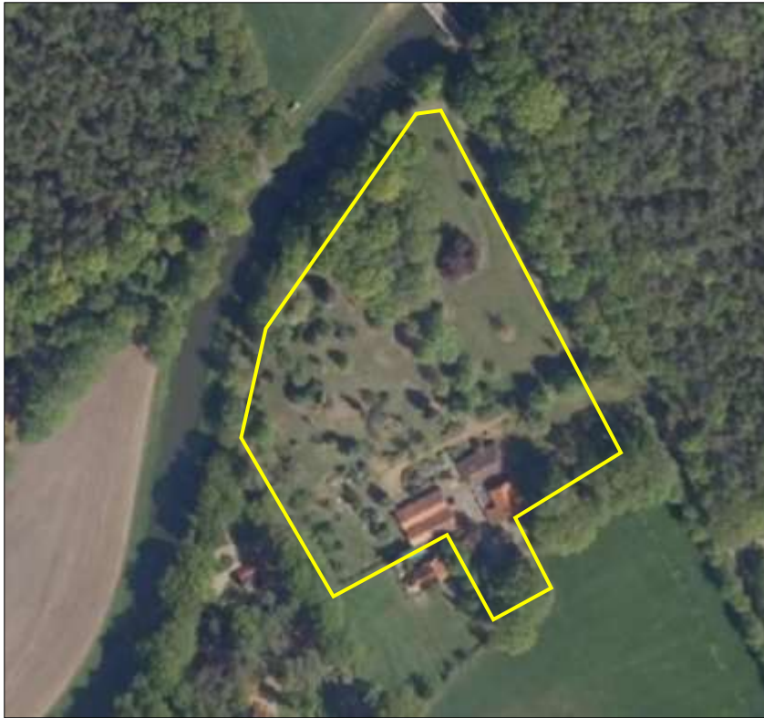
Begrenzing van het plangebied; deze wordt met de gele lijnen aangeduid.