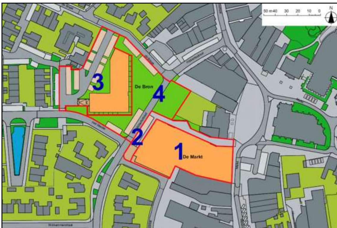
Afbeelding 2.2 Impressie ter plaatse van de deelgebieden