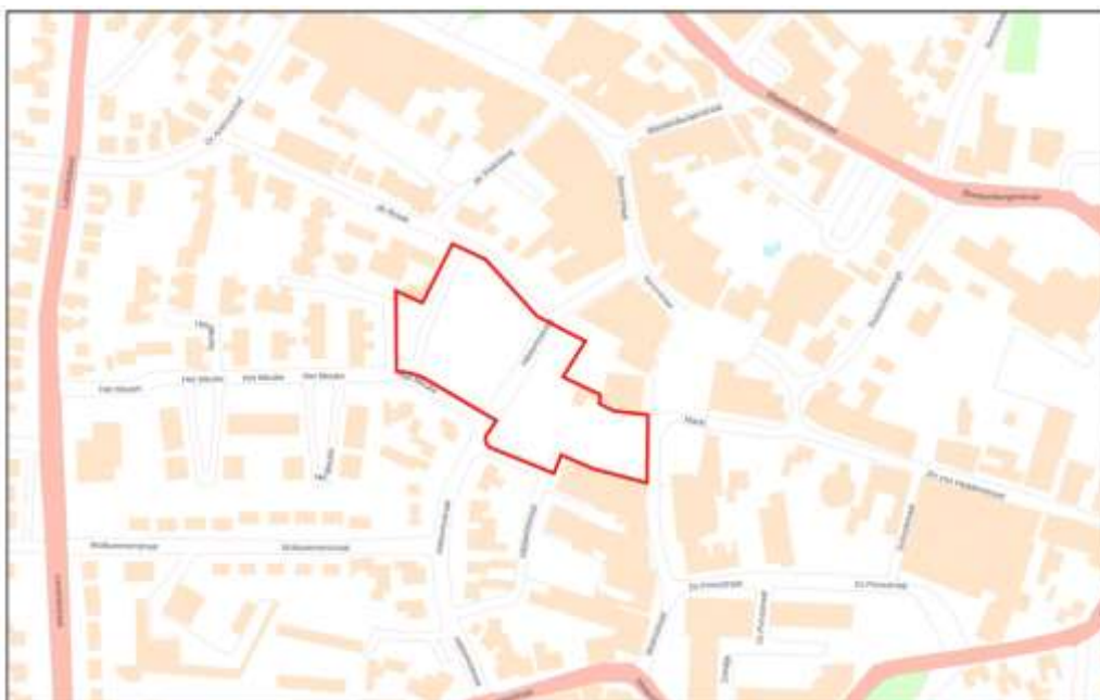
Afbeelding 2.3 Ligging van het projectgebied

Afvalstoffen worden zoveel mogelijk gescheiden om nuttige afvalstoffen op eenvoudige wijze te kunnen inzamelen en vervolgens te verwerken/recyclen. Er is geen sprake van de productie van gevaarlijk afval. De afvalstoffen zullen conform de daarvoor van toepassing zijnde reglementen worden afgevoerd.