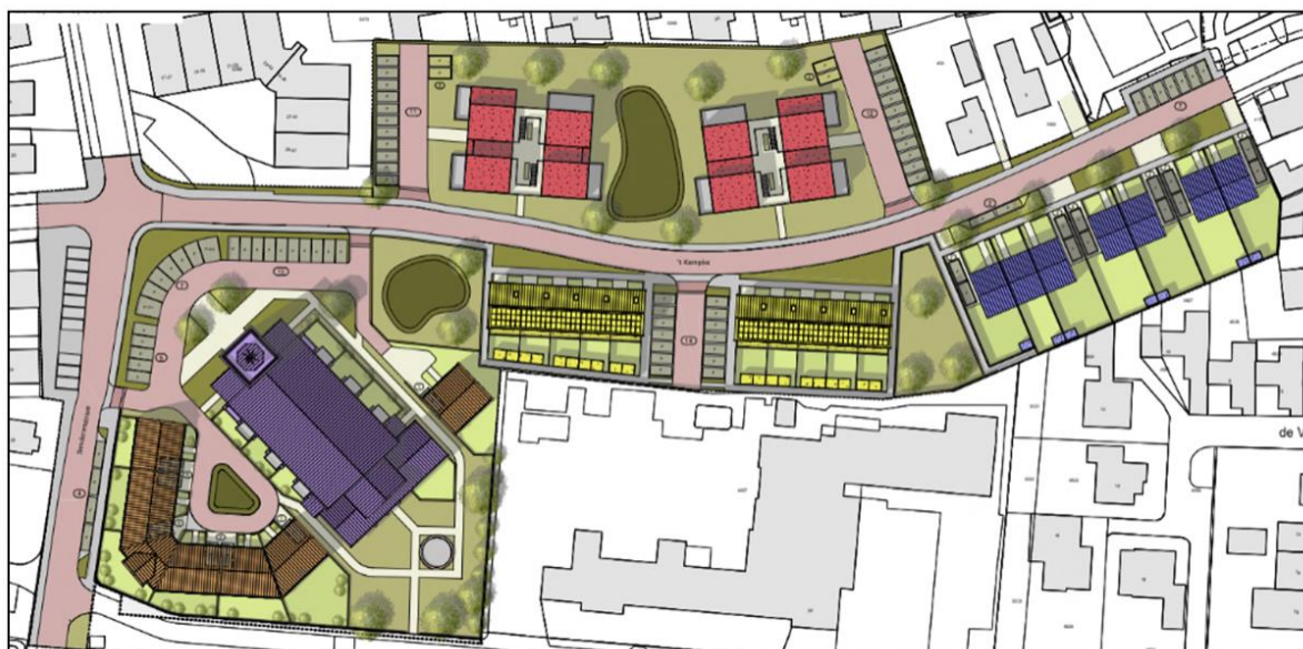
Afbeelding 3.2: Gewenste situatie projectgebied

In totaal ziet het voornemen toe op de realisatie van 69 woningen. Concreet gaat het om de volgende type en aantal woningen: