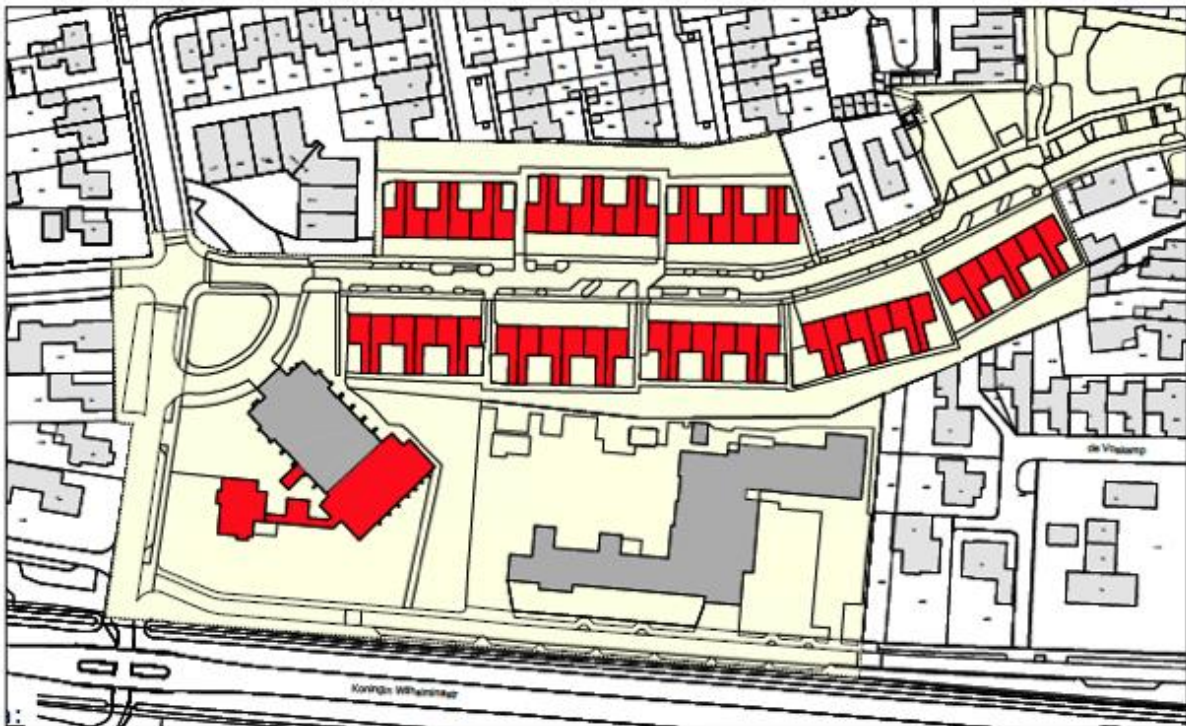
Afbeelding 2.1: Sloopopgave

Als onderdeel van de voorgenomen ontwikkeling, wordt nagenoeg alle bebouwing in het projectgebied gesloopt. De sloopopgave ziet toe op alle 96 woningen en aangebouwde onderdelen aan het kerkgebouw, waaronder de pastoriëwoning. In afbeelding 2.1 is de sloopopgave weergegeven. De te slopen bebouwing is rood aangegeven.