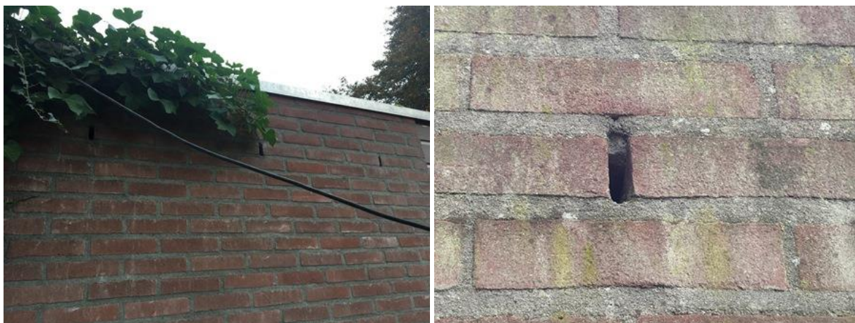
Potentiële invliegopeningen van vleermuizen in de buitengevel van de woning.

In deelgebied Maatweg ontbreken potentiële verblijfplaatsen van vleermuizen. Bomen met een potentiële verblijfplaats ontbreken in deelgebied Scholtenhagenweg, maar de woning wordt beschouwd als een potentiële verblijfplaats voor vleermuissoorten als gewone dwergvleermuis en gewone grootoorvleermuis. Er zijn tijdens het veldbezoek geen vleermuizen waargenomen en er zijn geen directe aanwijzingen gevonden die erop duiden dat vleermuizen een verblijfplaats in de woning bezetten, maar de woning beschikt over een (holle) spouw en in de buitengevel zijn open stootvoegen aangebracht. Vleermuizen kunnen de spouw betreden via deze open stootvoegen.