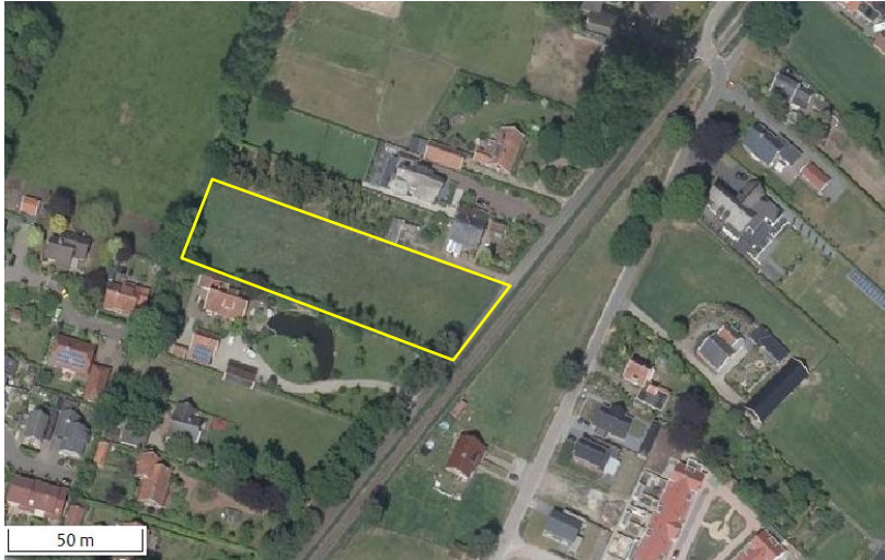
Detailopnames van deelgebied Maatweg. De begrenzing van het plangebied wordt met de gele lijn aangeduid.

Deelgebied Maatweg bestaat uit grasland met een agrarisch beheer. Het bestaat volledig uit een soortenarme vegetatie van raaigras. Het wordt jaarlijks bemest en gemaaid, waarbij het maaisel wordt afgevoerd. Op onderstaande afbeelding wordt een luchtfoto van het plangebied weergegeven, evenals de begrenzing. Voor een impressie van het plangebied wordt verwezen naar de fotobijlage.