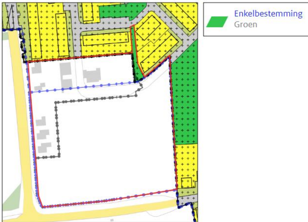
Afbeelding 1.5 Uitsnede verbeelding bestemmingsplan "Bestemmingsplan Buurse en St. Isidorushoeve"