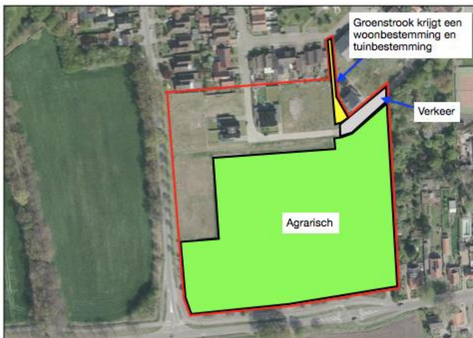
Afbeelding 3.4 Overige gronden plangebied