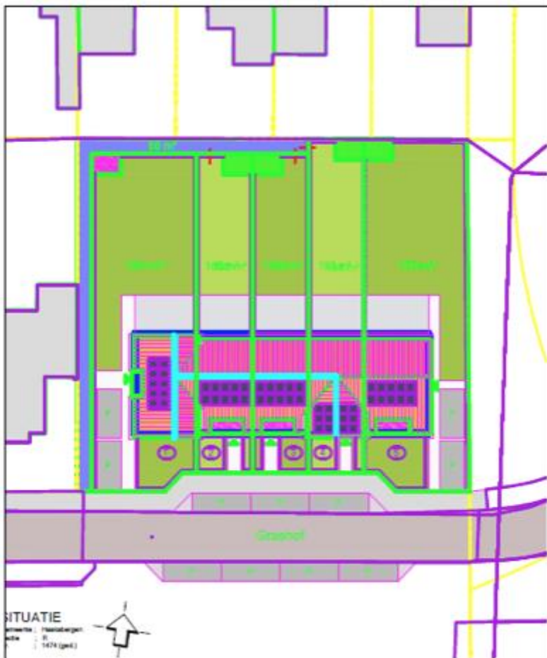
Afbeelding 3.2 Gewenste situatie rijwoningen

Opgemerkt wordt dat door voortschrijdend inzicht de woningbouw typologie aan de Grashof is gewijzigd ten opzichte van het oorspronkelijke stedenbouwkundige plan. In de praktijk is gebleken dat er in de gemeente Haaksbergen meer vraag is naar starterswoningen. Voor starters zijn twee aaneen gebouwde woningen veelal te duur. Hierdoor is ervoor gekozen om langs de Grashof vier twee aaneen gebouwde woningen te vervangen door vijf rijwoningen. Zodoende wordt met voorliggend herstelplan ingespeeld op de actuele woonbehoefte in Haaksbergen. In afbeeldingen 3.2 en 3.3 is respectievelijk de gewijzigde opzet en een impressie van rijwoningen weergegeven.