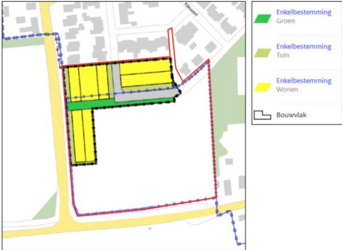
Afbeelding 1.4 Uitsnede verbeelding bestemmingsplan "Buurse Zuid"