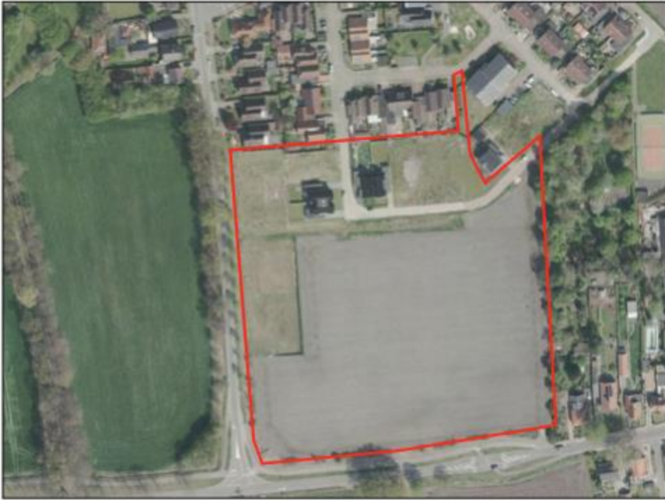
Afbeelding 2.1 Luchtfoto plangebied