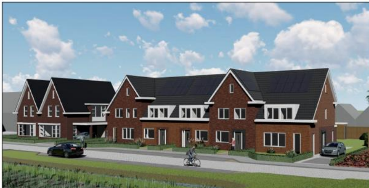
Afbeelding 3.3 Impressie rijwoningen (Bron: L&O Architecten)