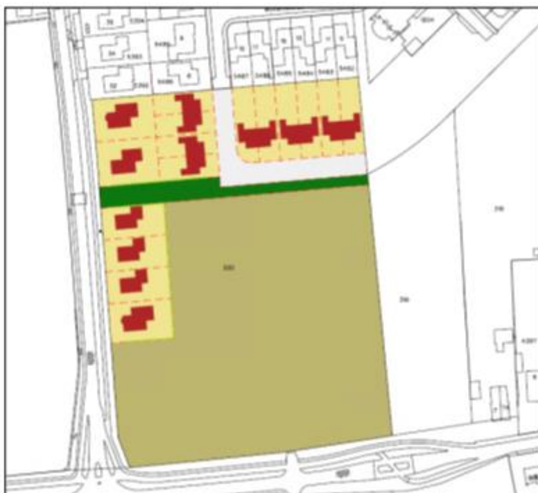
Afbeelding 3.1 Stedenbouwkundig plan

In afbeelding 3.1 is het stedenbouwkundig plan weergegeven.