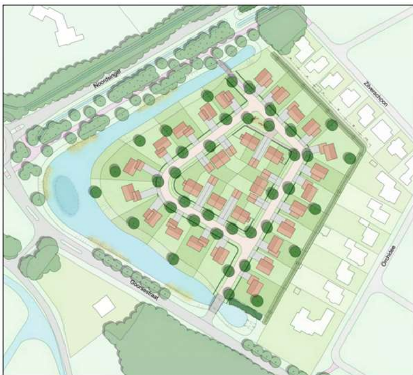
Verbeelding van het mogelijke eindbeeld na planrealisatie.

Het concrete voornemen bestaat om het plangebied te ontwikkelen als woningbouwlocatie. Om de bouw van woningen mogelijk te maken moet de aanwezige bebouwing gesloopt worden en de erfverharding en beplanting verwijderd worden. Onderdeel van het plan is de aanleg van een waterpartij langs de noordwest-, west- en zuidzijde van het plangebied. Op onderstaande afbeelding wordt het wenselijke eindbeeld weergegeven.