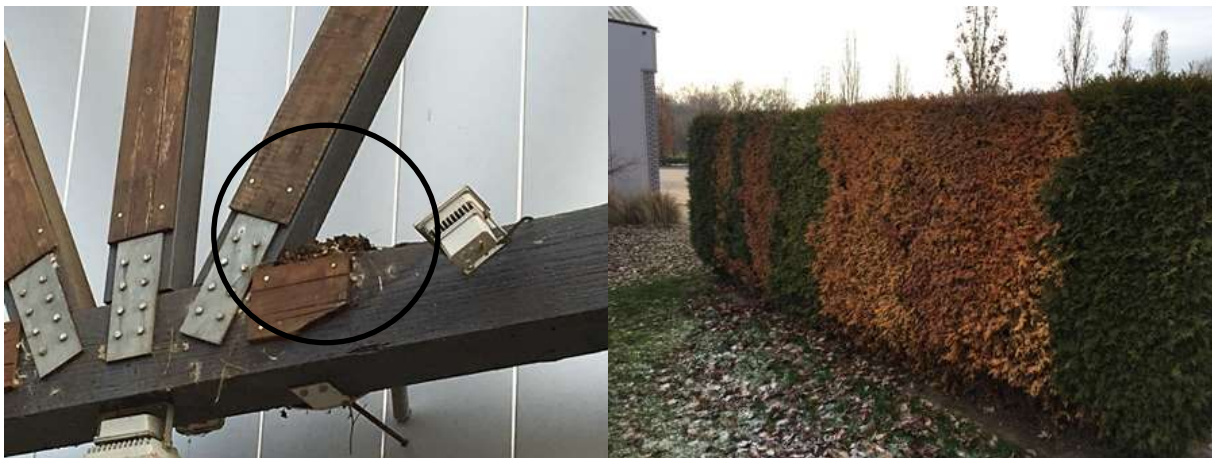
Foto links: oud nest van een houtduif. Rechts: potentiële nestplaats voor verschillende kleine zangvogels als merel, groenling, kneu, vink en heggenmus.

Het plangebied vormt geschikt leefgebied voor sommige vogelsoorten. Vogels benutten de buitenruimte als foerageergebied en vermoedelijk nestelen er ieder voortplantingsseizoen vogels op/aan de bebouwing en in de opgaande bomen, struiken, heesters en dichte vegetatie op de grond. Er is in het plangebied een oud nest van de houtduif waargenomen. Andere vogelsoorten die mogelijk in het plangebied nestelen zijn merel, groenling, kneu, vink, tjiftjaf en heggenmus. Behalve de overkapping aan de voorzijde van het gebouw, wordt de bebouwing als een ongeschikte nestplaats voor vogels beschouwd.