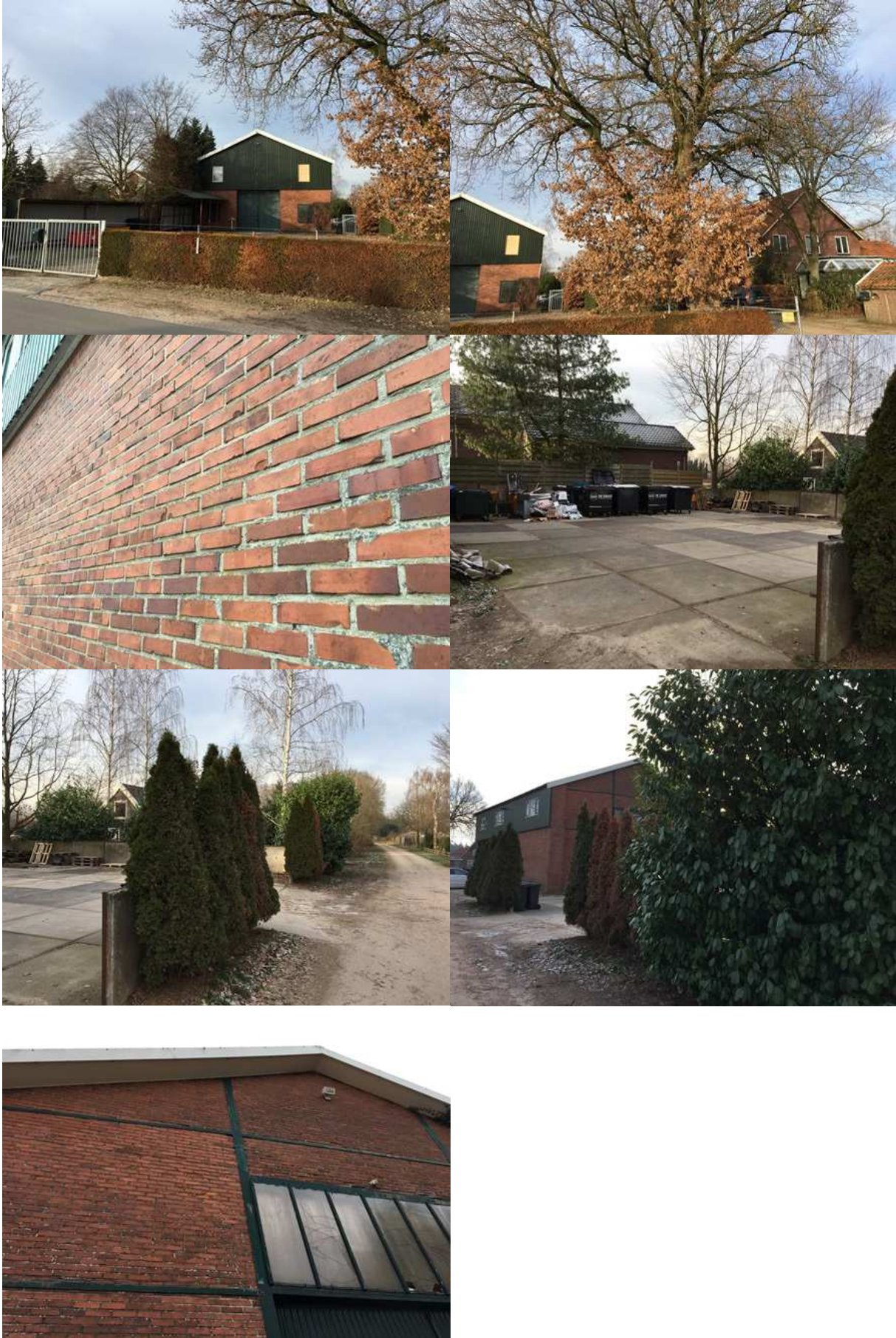
Bijlage 3. Fotobijlage. Impressie van het plangebied en de directe omgeving.