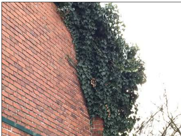
Klimop aan het bedrijfspand; mogelijke broedplaats voor vogels.

Het plangebied vormt geschikt leefgebied voor verschillende vogelsoorten. Vogels benutten de buitenruimte als foerageergebied en vermoedelijk nestelen er ieder voortplantingsseizoen vogels in de beplanting in het plangebied, zoals de scheerhaag, solitaire coniferen en de klimop aan het gebouw. Vogelsoorten die mogelijk in het plangebied nestelen zijn merel, houtduif, groenling, staartmees, heggenmus en Turkse tortel. Er zijn in het plangebied geen huismussen waargenomen. Gelet op de bouwstijl van de bebouwing, wordt deze als een ongeschikte nestplaats voor huismussen beschouwd.