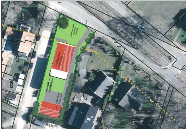
Verbeelding van het wenselijke eindbeeld.

Het concrete voornemen bestaat om de in het plangebied aanwezig bebouwing te slopen en een vrijstaande woning met bijgebouw in het plangebied op te richten. De coniferen- en taxus scheerhaag en de solitaire coniferen worden gerood. De zomereik langs de Oude Boekeloseweg blijft behouden. Op onderstaande afbeelding wordt het wenselijke eindbeeld van het plangebied weergegeven.