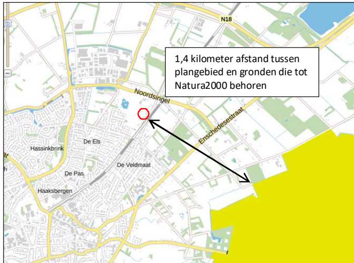
Ligging van Natura2000-gebied in de omgeving van het plangebied. De ligging van het plangebied wordt met de rode cirkel aangegeven. Gronden die tot Natura2000 behoren worden met de okergele kleur aangeduid (bron: Provincie Overijssel).