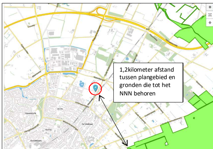
Ligging van Natuurnetwerk Nederland in de omgeving van het plangebied. Gronden die tot het Natuurnetwerk Nederland behoren worden met de groene kleur op de kaart aangeduid.