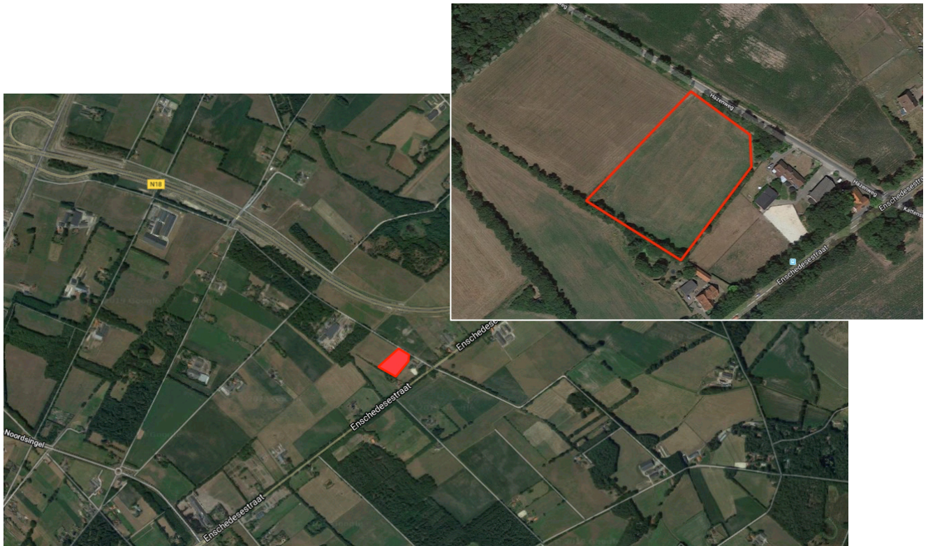
Afbeelding 1. Locatie plangebied (rood)

De planlocatie betreft een agrarisch perceel waarop gras- en akkerbouw plaatsvindt. Langs de Hazenweg wordt het perceel begrensd door een waterafvoersloot. Aan drie kanten wordt het perceel omsloten door een bomerij met daaronder een struiklaag.