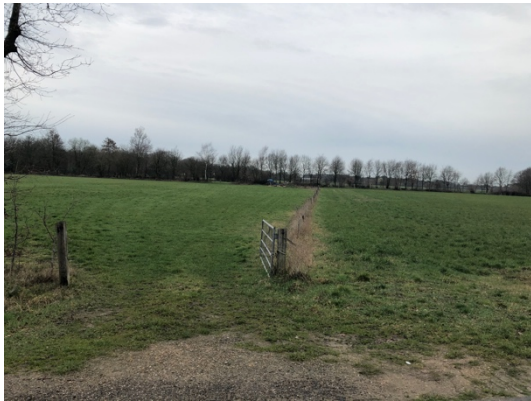
Overzicht planlocatie vanaf de Hazenweg