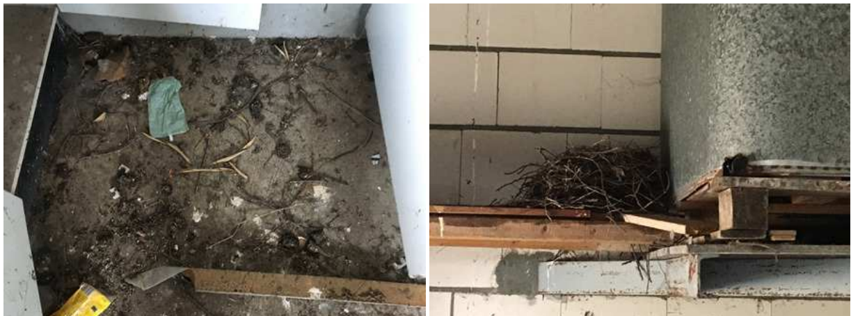
Foto links: braakballen van de kerkuil. Foto rechts; oud en verlaten nest van de houtduif.

Het plangebied behoort tot het functionele leefgebied van verschillende vogelsoorten. Vogels benutten het plangebied als foerageergebied en benutten toegankelijke gebouwen als nestplaats. Er zijn tijdens het veldbezoek oude nesten van de houtduif waargenomen. Andere soorten die mogelijk in de bebouwing nestelen zijn holenduif, merel, koolmees en witte kwikstaart. In één van de oude varkensstallen zijn braakballen van een kerkuil waargenomen. Deze soort benut de stal vermoedelijk incidenteel als rustplaats. Gelet op het beperkte aantal braakballen is het geen vaste rustplaats. De stal vormt een ongeschikte nestplaats.