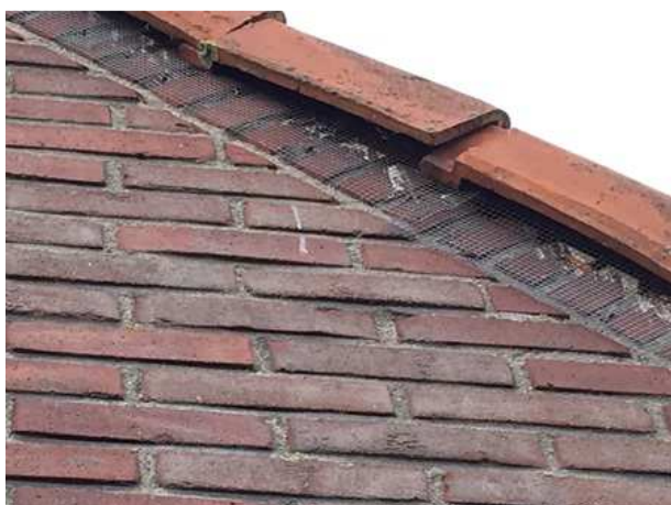
Vogelwerend gaas onder de gevelpannen. Hierdoor kunnen vogels niet onder de dakpannen nestelen.

Er zijn in het plangebied geen huismussen vastgesteld. De bebouwing wordt als een ongeschikte nestplaats voor de huismus beschouwd. Onder de gevelpannen en de onderste rij dakpannen is vogelwerend gaas aangebracht waardoor vogels, zoals de huismus, niet onder de dakpannen kunnen nestelen.