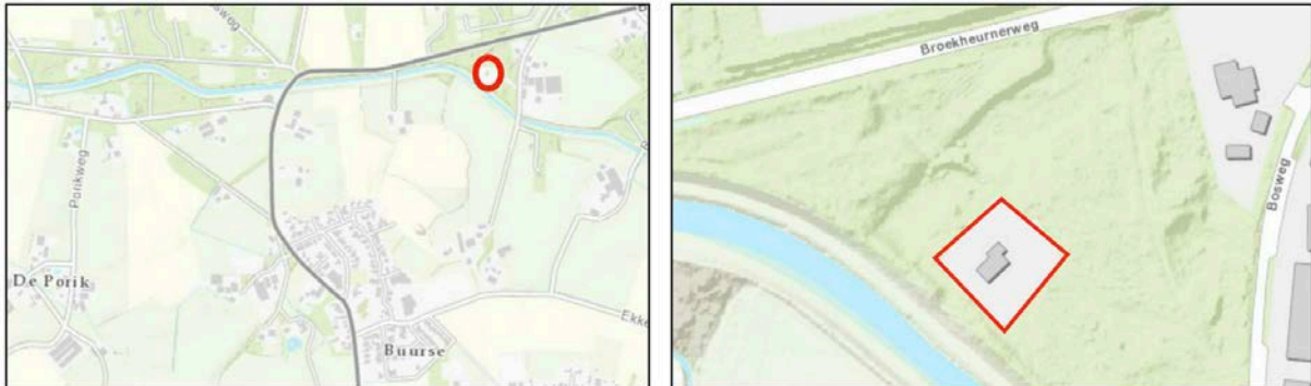
Figuur 2.1 Ligging projectgebied ten opzichte van de kern Buurse

Het projectgebied is gelegen aan de Bosweg 2a -Z, in het buitengebied van Haaksbergen. Het perceel bevindt zich nabij de Buurser Beek, op korte afstand van de kern Buurse en staat kadastraal bekend als gemeente Haaksbergen, sectie R, nummer 263. In figuur 2.1 is de ligging van het projectgebied indicatief ten opzichte van de kern Buurse en de directe omgeving weergegeven middels de rode omlijning.