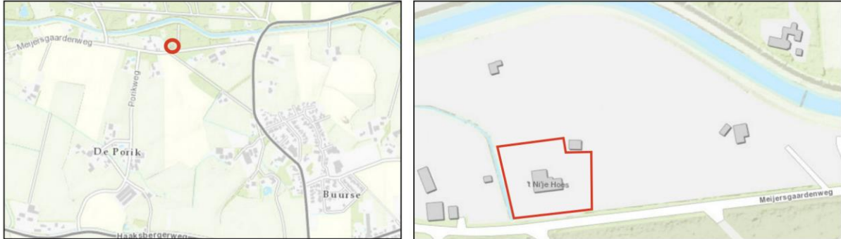
Figuur 2.1 Ligging projectgebied ten opzichte van de kern Buurse

Het projectgebied is gelegen aan de Meijersgaardenweg 23 -Z, in het buitengebied van Haaksbergen. Het perceel bevindt zich nabij de Buurser Beek, op korte afstand van de kern Buurse en staat kadastraal bekend als gemeente Haaksbergen, sectie R, nummer 43. In figuur 2.1 is de ligging van het projectgebied indicatief ten opzichte van de kern Buurse en de directe omgeving weergegeven middels de rode omlijning.