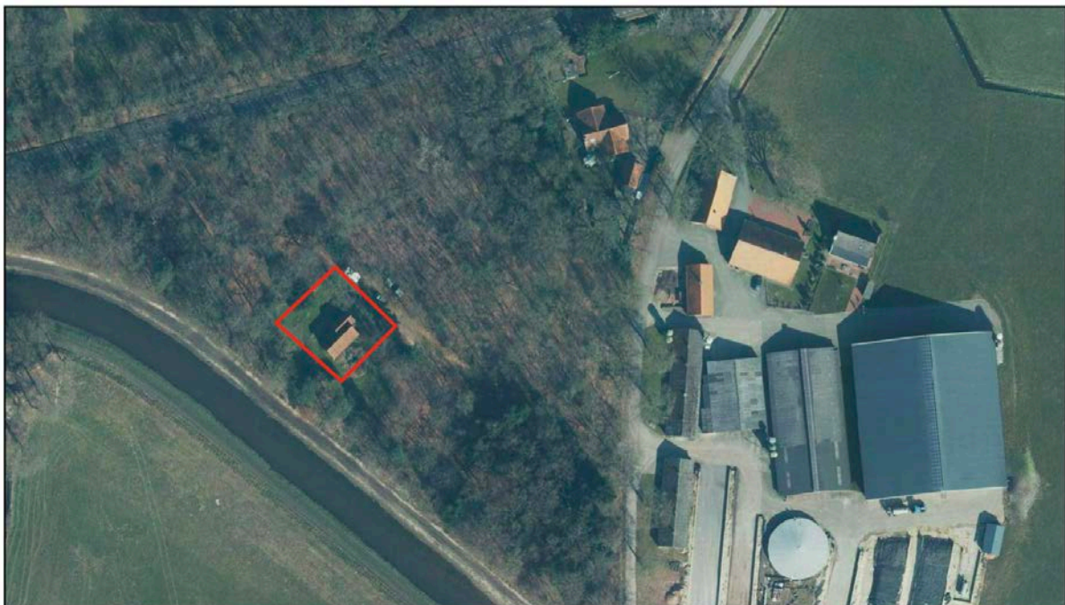
Figuur 2.2 Ligging perceel ten opzichte van de directe omgeving (Bron: Provincie Overijssel)

In het projectgebied bevindt zich een recreatiewoning zonder vrijstaande bijgebouwen. De grond rondom de recreatiewoning is voornamelijk in gebruik als tuin of verhard. In figuur 2.2 is een luchtfoto met daarin de huidige situatie op het perceel opgenomen. Het projectgebied is hierbij wederom indicatief aangegeven middels de rode omlijning.