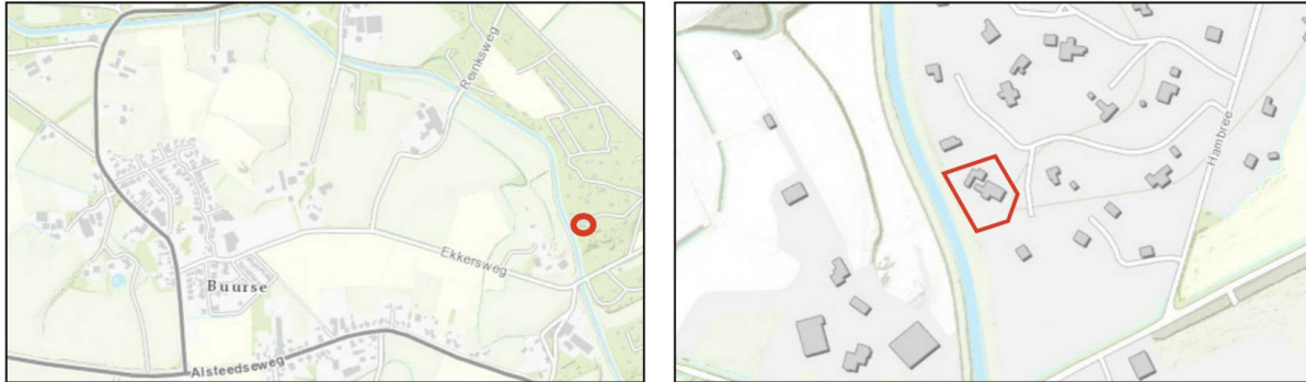
Figuur 2.1 Ligging projectgebied ten opzichte van de kern Buurse

Het projectgebied is gelegen aan de Hambree 13 -Z, in het buitengebied van Haaksbergen. Het perceel bevindt zich nabij de Buurser Beek, op korte afstand van de kern Buurse en staat kadastraal bekend als gemeente Haaksbergen, sectie R, nummer 282. In figuur 2.1 is de ligging van het projectgebied indicatief ten opzichte van de kern Buurse en de directe omgeving weergegeven middels de rode omlijning.