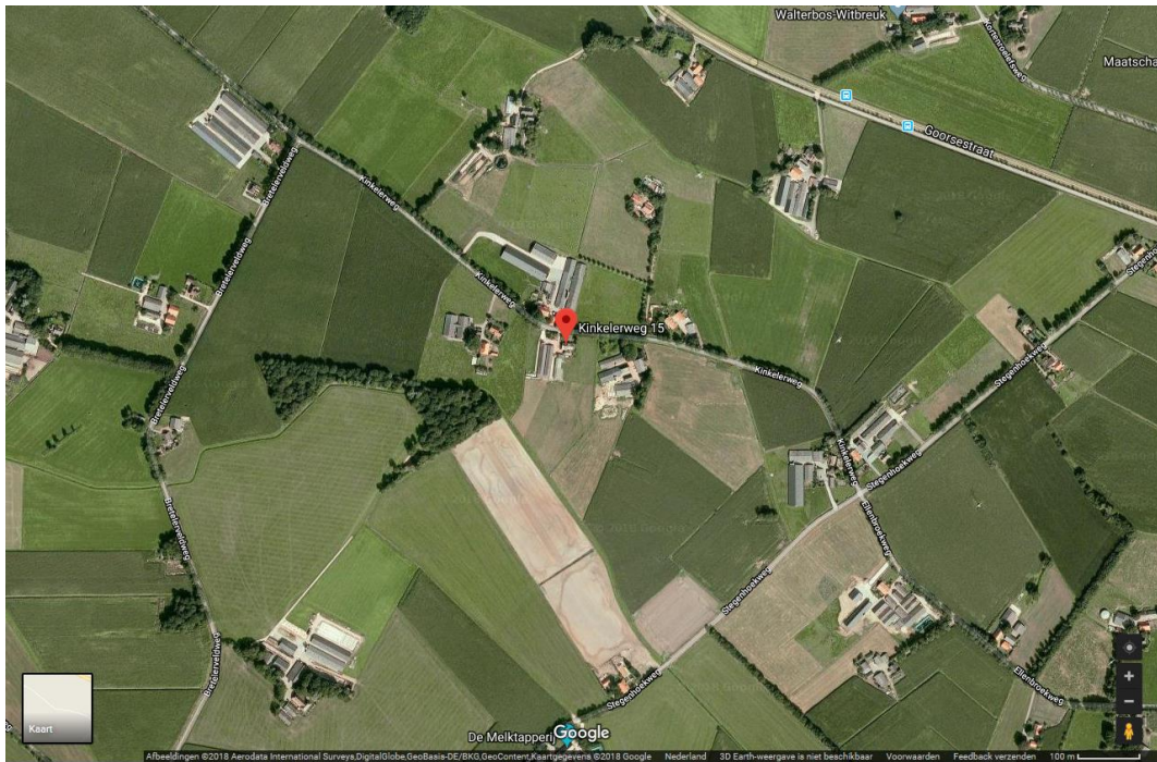
Figuur 2: luchtfoto plangebied.