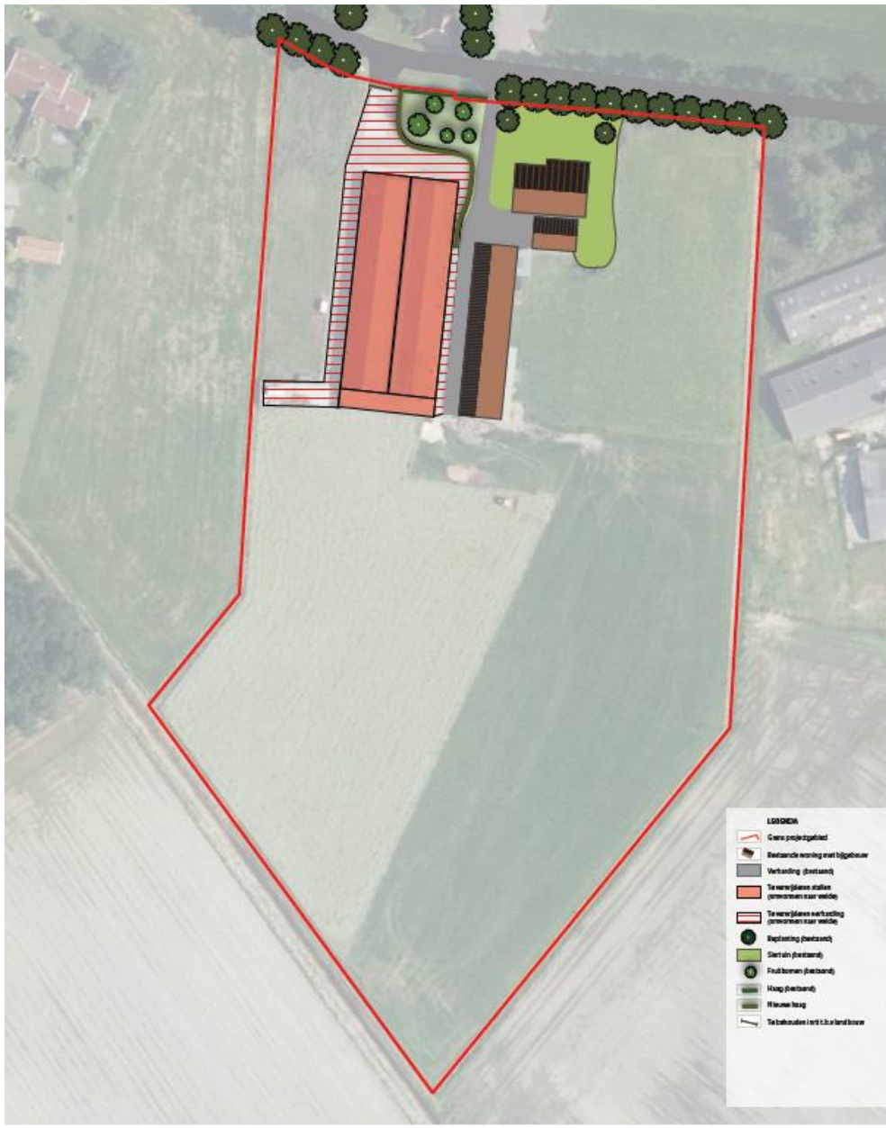
Figuur 1: Plangebied en voorgenomen ontwikkeling.