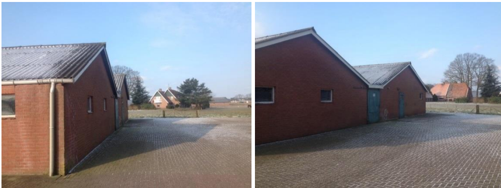
Figuur 3. Impressie plangebied, situatie op 28 februari 2018.