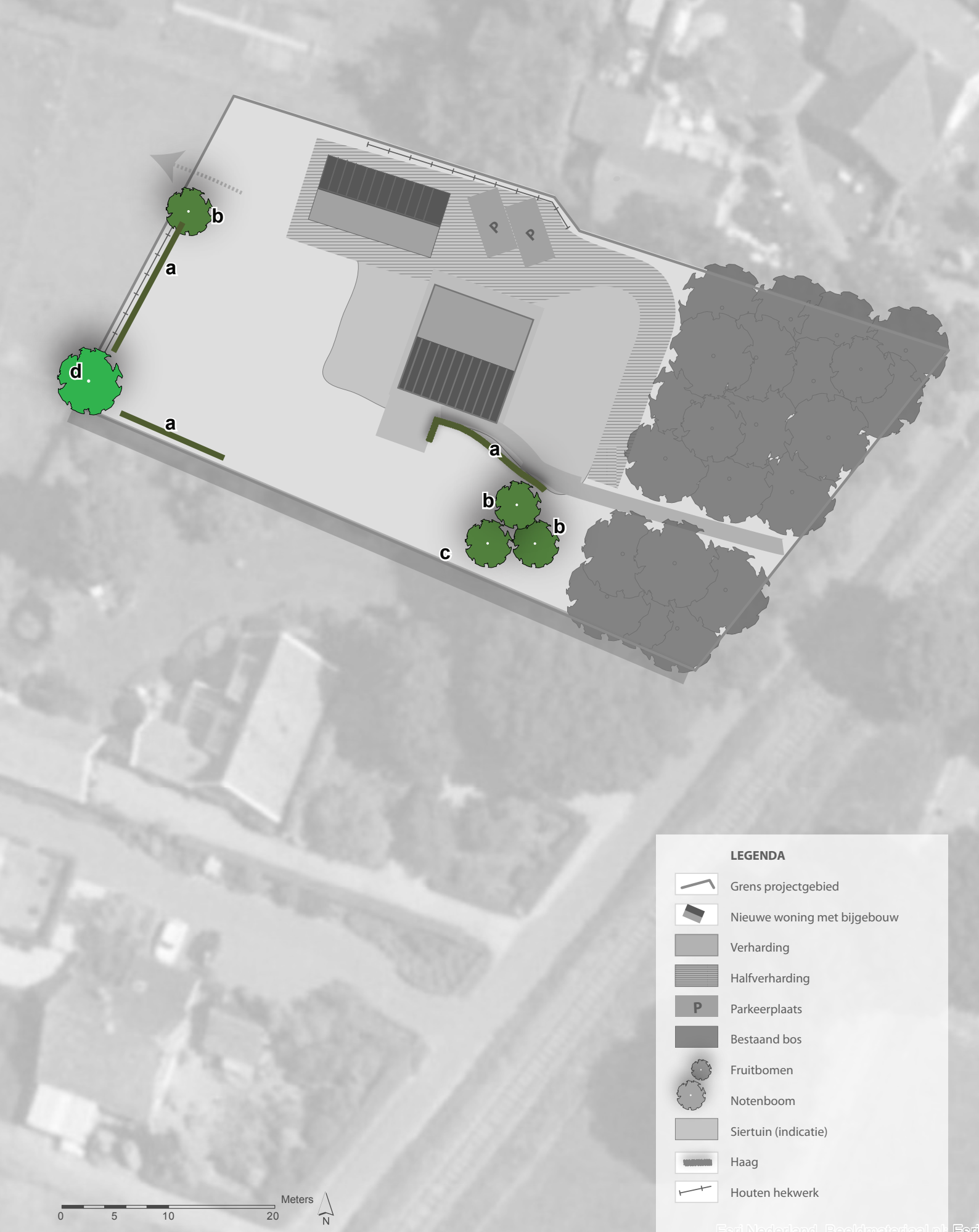
Afbeelding 28. Beplantingsplan