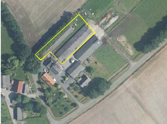
Detailweergave en begrenzing van deelgebied Stegenhoekweg 12.

Dit deelgebied vormt een deel van een bestaand erf en bestaat volledig uit bebouwing en erfverharding. In het plangebied staan twee voormalige varkensstallen. Eén gebouw is gebouwd van bakstenen en één gebouw is gebouwd van hout. De stenen stal heeft geïsoleerde muren, de houten stal heeft geen muurisolatie. De daken van beide stallen zijn geïsoleerd met hardschuimisolatiepanelen. Op onderstaande luchtfoto wordt het plangebied in detail weergegeven.