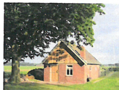
Inrichtingsplan voor de Voordtweg ong.