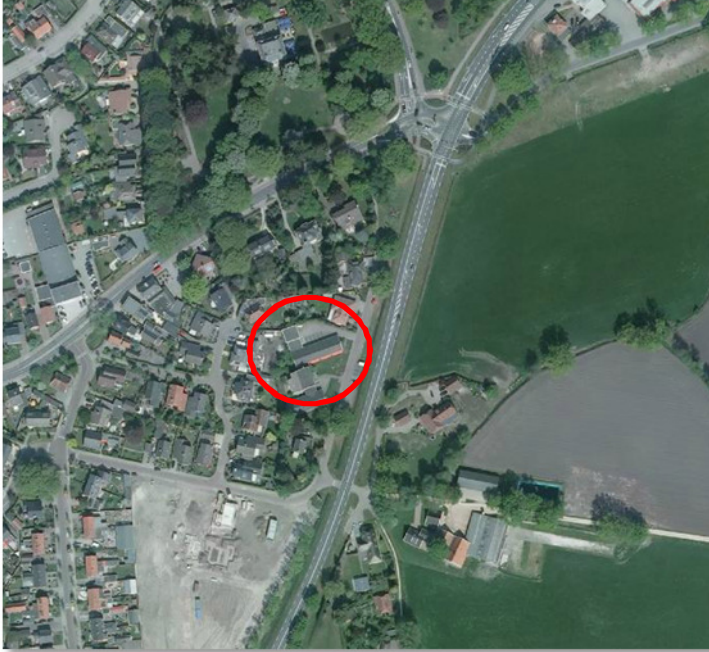
Situering van het plangebied. Het plangebied wordt met de rode contour aangeduid.

Het plangebied is gelegen aan de Veldkampstraat 9-13 in Haaksbergen. Het ligt aan de oostzijde van het dorp Haaksbergen. Op onderstaande afbeelding wordt de globale ligging van het plangebied weergegeven.