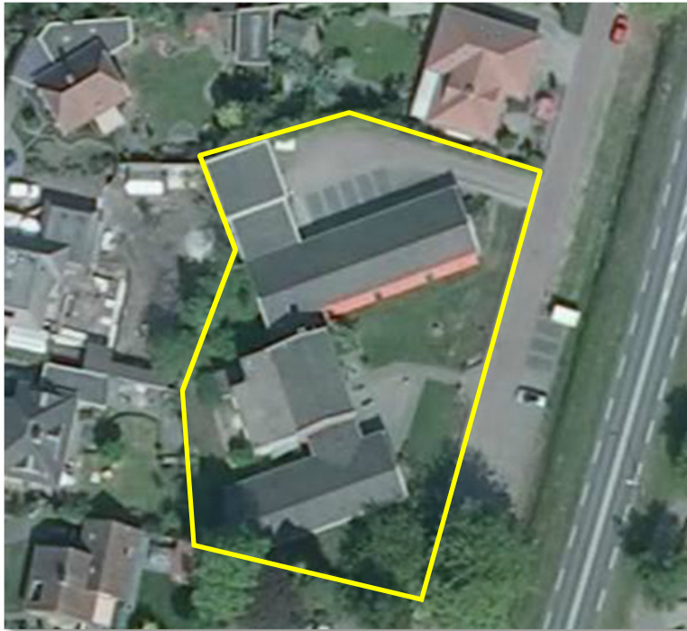
Detailopname van het onderzoeksgebied; deze wordt met de gele lijn aangeduid.