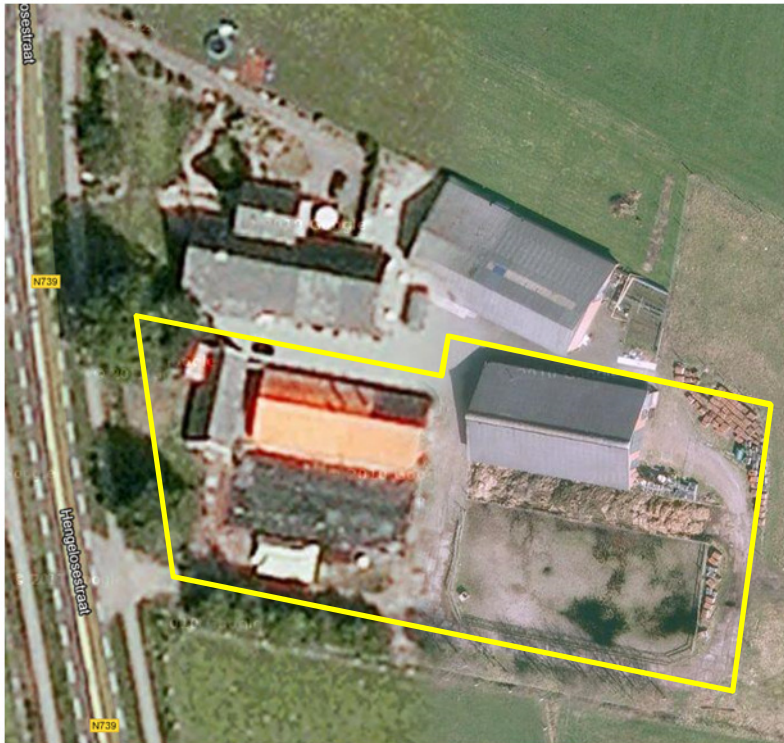
Detailopname van het onderzoeksgebied; deze wordt met de gele lijn aangeduid.