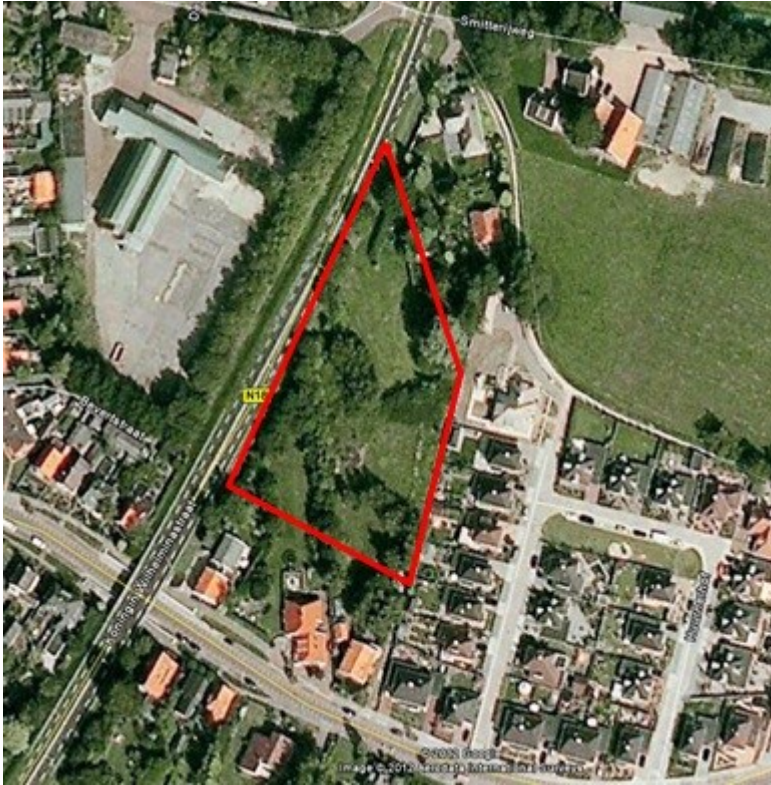
Figuur 1: Ligging plangebied (rood omlijnd).

Voor de locatie Smitterijhof in Haaksbergen bestaan herontwikkelingsplannen. Het betreft een groengebied, waarin 5-6 woningen worden gebouwd. In opdracht van Aveco de Bondt is een verkennend natuuronderzoek uitgevoerd naar de (mogelijke) functies van het terrein voor beschermde soorten. Voorliggend rapport bevat de uitkomsten van dit verkennend natuuronderzoek.