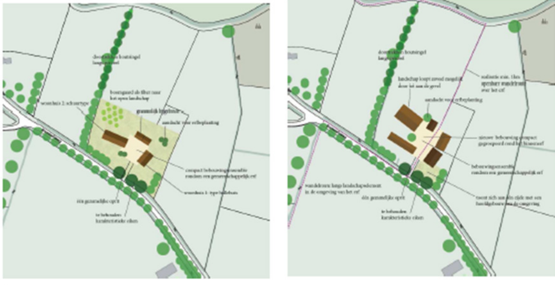
Twee scenario's voor herontwikkeling van het erf.