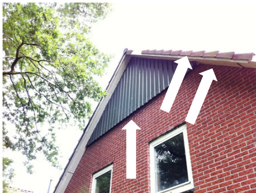
Mogelijke verblijfplaatsen voor vleermuizen in het hoofdgebouw (zie pijlen).

Er zijn geen vleermuizen in het plangebied vastgesteld. De toegepaste onderzoeksmethode (visuele inspectie) is echter ontoereikend om de aanwezigheid van vleermuizen in het plangebied vast te stellen. Met name het (vervallen) hoofdgebouw is in potentie geschikt als verblijfplaats voor vleermuizen. De eindpannen met oversteek, de houten topgevel en de houten overstekken zijn bekende potentiële verblijfplaatsen voor vleermuissoorten als Laatvlieger en Gewone dwergvleermuis. De zolder van het hoofdgebouw is als ongeschikt beoordeeld als verblijfplaats voor vleermuizen. Deze is tochtig en te vatbaar voor weersinvloeden.