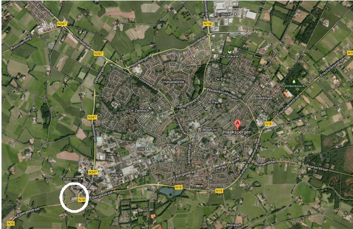
Situering van het plangebied en de omgeving. Het plangebied wordt met de cirkel aangeduid.

Het plangebied is gesitueerd in het oksel van de Tolstraat en de Eibergsestraat (N18) in Haaksbergen. Het ligt in de uiterste zuidwesthoek van de dorpskern van Haaksbergen. Aan de westzijde grenst het aan het industrieterrein. De overige zijden grenzen aan het agrarische cultuurlandschap.