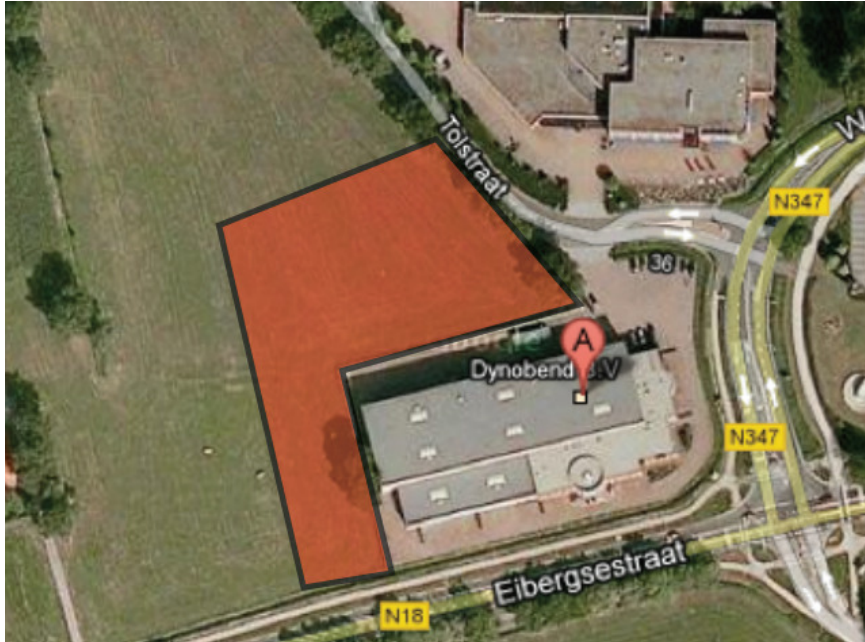
Illustratie van de wenselijk uitbreiding van het industriële bedrijventerrein. De wenselijke uitbreiding wordt met de rode contour aangeduid.