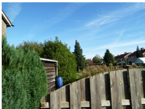
Afbeelding 2 achterkant huizenblok met enkele verruigde tuinen.