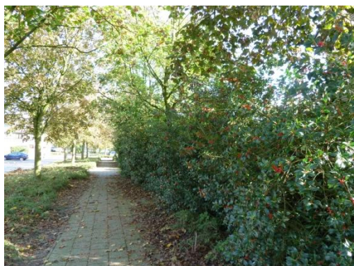
Afbeelding 1 groenstrook langs de noordkant van het projectgebied.

Onderstaande foto's geven een impressie van het plangebied en de directe omgeving: