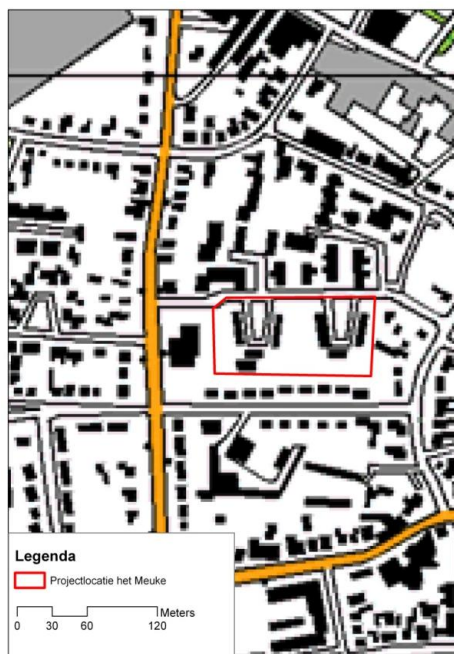
Figuur 1a: Plangebied

Het onderzoek heeft bestaan uit een visuele inspectie van het plangebied en het raadplegen van vrij beschikbare verspreidingsgegevens van beschermde dier- en plantensoorten.