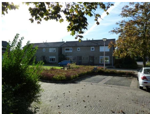
Afbeelding 3 en 4 de te slopen woningen.