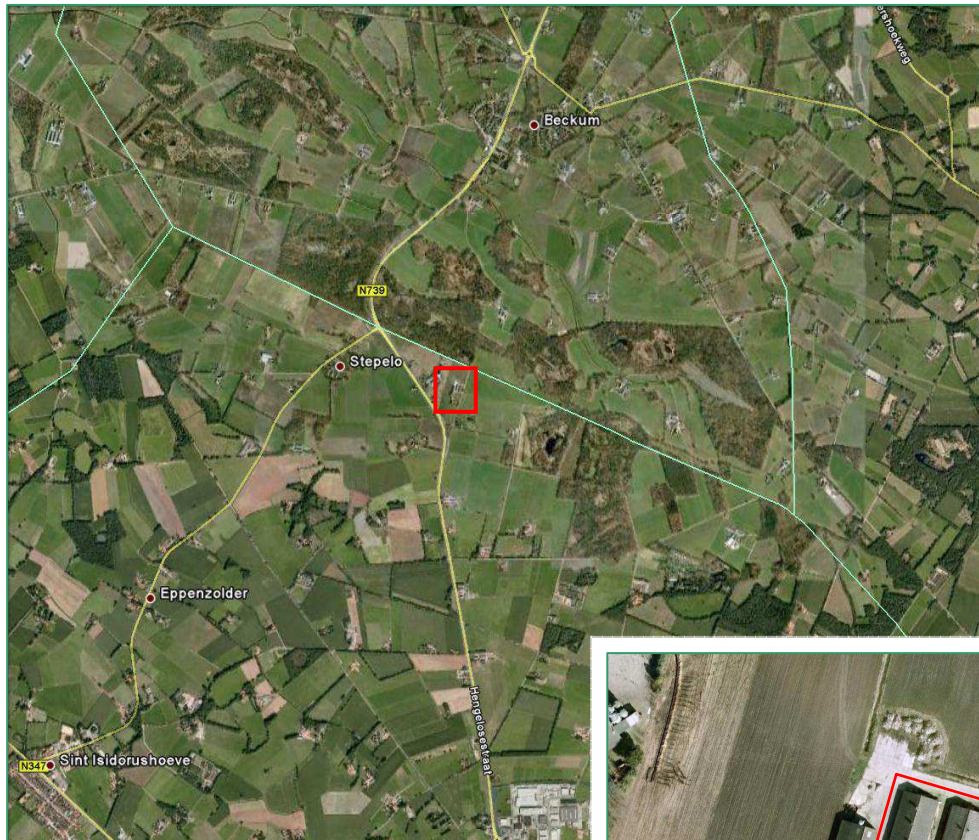
Figuur 1. Ligging onderzoeksgebied. Op de uitsnede is de ligging van de te slopen schuren weergegeven.