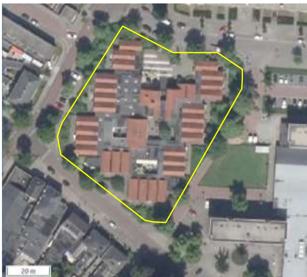
Detailopname van het plangebied. De begrenzing van het plangebied wordt met de gele lijn aangeduid.

In het plangebied is een woon-zorginstelling gevestigd. Het plangebied bestaat uit bebouwing, erfverharding en tuinbeplanting in de vorm van bomen, struiken, heesters en sierplanten. In het plangebied staan negenentwintig zorgwoningen, rondom enkele centrale gebouwen. Alle gebouwen zijn gebouwd van bakstenen en gedekt met dakpannen. De gebouwen beschikken over een (holle) spouw en een beschoten kap. De staat van onderhoud van de gebouwen is goed; ze zijn allemaal wind- en waterdicht. Op onderstaande luchtfoto wordt het plangebied in detail weergegeven, evenals de begrenzing. Voor een impressie van het plangebied wordt verwezen naar de fotobijlage.