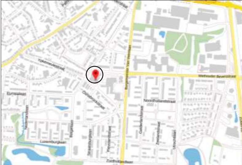
Ligging van het plangebied op de topografische kaart. Het plangebied wordt met de cirkel aangeduid.

Het plangebied is gesitueerd op het adres Wethouder Beversstraat 12 te Enschede. Het ligt in de stad Enschede en wordt aan alle zijden omgeven door stedelijk gebied. Op onderstaande afbeelding wordt de ligging van het plangebied weergegeven op de topografische kaart.