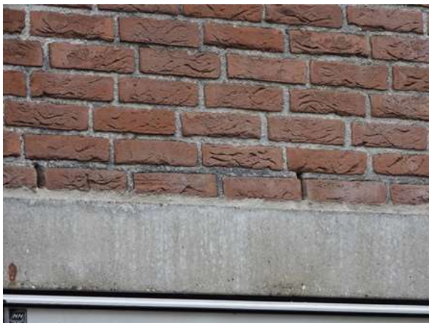
Open stootvoegen vormen een potentiële invliegopening voor vleermuizen.

Er zijn tijdens het veldbezoek geen vleermuizen waargenomen en er zijn geen aanwijzingen gevonden dat vleermuizen een verblijfplaats bezetten in het plangebied, maar gelet op de bouwstijl van de gebouwen, kan de aanwezigheid van een verblijfplaats van een vleermuis in de spouw of het dakvlak, niet uitgesloten worden. Gebouwbewonende vleermuissoorten als gewone dwergvleermuis en laatvlieger kunnen een verblijfplaats bezetten in de spouw en onder de dakpannen. De spouw is op meerdere plekken bereikbaar via open stootvoegen. Het dakvlak is bereikbaar via de gevelpannen.