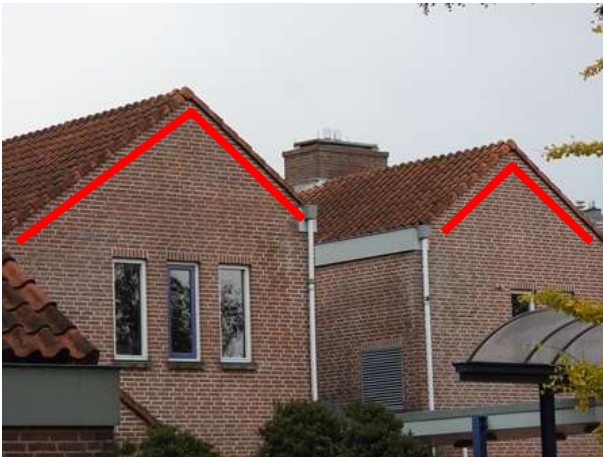
Gevelpannen vormen een potentiële invliegopening voor gierzwaluwen die een nestplaats bezetten onder de dakpannen.

Het plangebied behoort tot functioneel leefgebied van verschillende vogelsoorten. Vogels benutten de buitenruimte van het plangebied als foerageergebied en vermoedelijk nestelen er ieder voortplantingsseizoen vogels in het plangebied. Vogelsoorten die mogelijk in het plangebied nestelen zijn merel, zanglijster, winterkoning, roodborst, heggemus, koolmees, pimpelmees, groenling, houtduif, Turkse tortel en tjiftjaf. Voorgenoemde soorten kunnen nestelen in bomen, struiken, nestkastjes en in dichte vegetatie, zoals heesters en sierplanten. Er zijn in het plangebied geen huismussen waargenomen en er zijn geen aanwijzingen gevonden dat andere vogelsoorten in de gebouwen (dakvlak) nestelen. De bouwstijl, maakt de lage bebouwing tot een ongeschikte nestplaats voor soorten als huismus en gierzwaluw. Het centrale gebouw bestaat uit een gebouw met twee verdiepingen, deze vormt een potentiële nestplaats voor de gierzwaluw. Gierzwaluwen nestelen onder dakpannen en kunnen gevelpannen benutten als invliegopening.