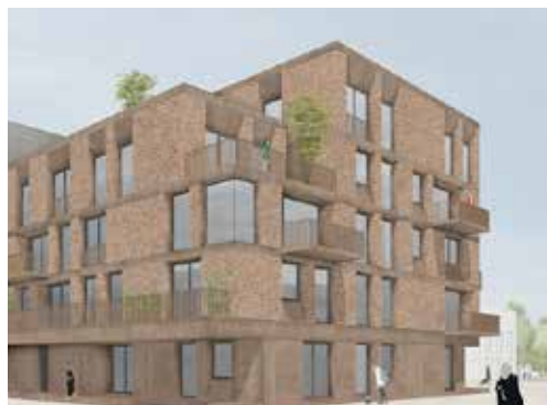
Verschillende hoekoplossingen en verspringingen in de gevel