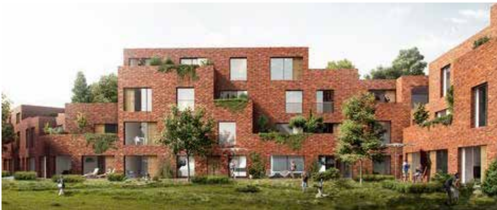
Het gebouw heeft zachte overgangen naar het groen rondom.