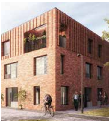
Door bovenste verdieping heeft aanpassing in patroon