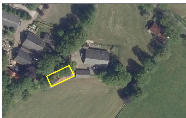
Begrenzing van het plangebied; deze wordt met de gele lijn aangeduid.

Het plangebied vormt een deel van een agrarisch erf en bestaat volledig uit bebouwing, er staat geen beplanting. De bebouwing bestaat uit een schuur met aanbouw en een kapschuur. Zowel de schuur als de aanbouw beschikken over bakstenen buitengevels zonder luchtspouw en over een dakpannen gedekt zadeldak zonder dakbeschot of dakisolatie. De kapschuur beschikt over enkele houten buitenwanden en over een golfplaten gedekt zadeldak. Ten noorden en ten westen van het plangebied staan enkele solitaire loofbomen. Ten zuiden van het plangebied ligt intensief beheerd agrarisch cultuurland, tijdens het veldbezoek in gebruik als grasland. De Lutje Esweg ligt ten noorden van het plangebied. Op onderstaande luchtfoto is de begrenzing van het plangebied aangegeven. Voor een impressie van het plangebied wordt verwezen naar de fotobijlage.