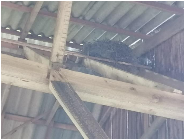
Oud nest van kauw in kapschuur

Het plangebied wordt vermoedelijk benut als foerageergebied door verschillende amfibieën-, vogel- en beschermde grondgebonden zoogdiersoorten en mogelijk nestelen er vogels in de toegankelijke bebouwing, bezetten huisspitsmuizen er een vaste rust- en voortplantingsplaats en bezetten amfibiesoorten als bruine kikker en gewone pad er een (winter)rustplaats. De bebouwing vormt geen vaste rust- of voortplantingsplaats voor steenmarter of egel. Er zijn geen potentiële rust- en voortplantingsplaatsen voor egel en steenmarter waargenomen in de toegankelijke bebouwing zoals, hooibalen, oude takkenbossen, holle ruimtes in de bebouwing, zoals de ruimte tussen een verdiepingsvloer of plafondbetimmering. Tevens zijn er geen aanwijzingen (zoals prooiresten) gevonden die duiden op de aanwezigheid van steenmarter. Mogelijk nestelen vogelsoorten als kauw, houtduif, holenduif, merel en winterkoning in de bebouwing. Er zijn ook nesten van huiszwaluwen waargenomen aan de buitengevel van de te verbouwen schuur. Alle bebouwing in het plangebied beschikt over invliegopeningen en vormen een potentiële nestplaats voor vogels. Vleermuizen bezetten geen vaste rust- of voortplantingsplaats in het plangebied en gebruiken het ook niet als foerageergebied. Vermoedelijk vliegen verschillende vleermuissoorten wel over een deel van het plangebied tijdens het foerageren langs de solitaire loofbomen ten noorden en ten westen van het plangebied.