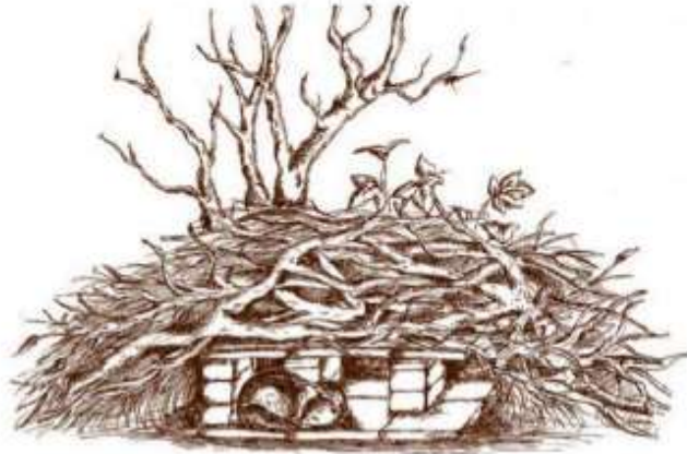
Figuur B3.1 Een tekening van een vervangende steenmartenverblijfplaats zoals voorgesteld door de zoogdiervereniging.