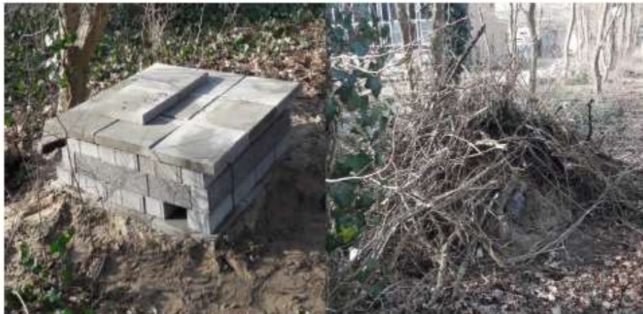
Figuur B3.2 Voorbeeld van een steenmartenverblijfplaats, met een fundering van stenen (links) en afgewerkt met takken (rechts).