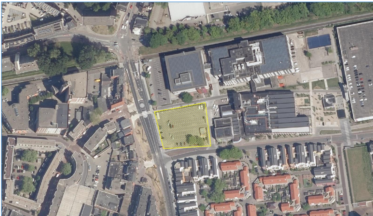
Afbeelding 1: Overzicht van de bestaande situatie (projectlocatie geel gearceerd)

Onder de naam Performance Factory worden de voormalige Polaroid fabrieken te Enschede herontwikkeld. De locatie is gesitueerd in het centrum van Enschede, nabij het centraal station. De nieuwbouw wordt op het bedrijventerrein gerealiseerd.