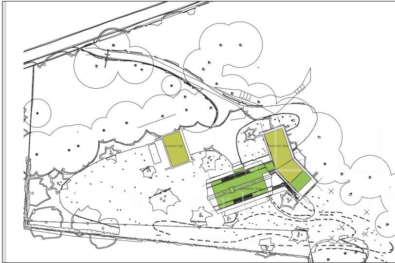
Verbeelding van het wenselijke eindbeeld.

Het voornemen bestaat om een woning en bijgebouwen te bouwen op een perceel braakland en het erf te ontsluiten via een bestaande weg in het bos. Om de weg gangbaar te maken hoeven geen bomen of struiken gerooid te worden. Alleen de aanwezige bramenvegetatie moet verwijderd worden en mogelijk wordt de bosweg voorzien van een nieuwe laag halfverharding. Op onderstaande afbeelding wordt het wenselijke eindbeeld weergegeven van het erf en de ontsluitingsweg.