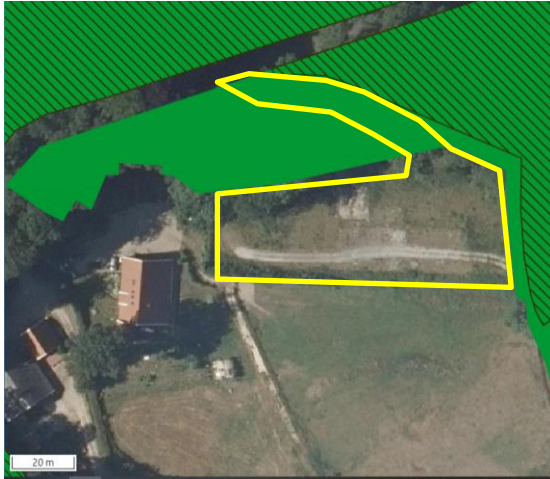
Ligging van Natuurnetwerk Nederland in de omgeving van het plangebied. De begrenzing van het plangebied wordt met de gele lijn aangeduid. Gronden die tot Natuurnetwerk Nederland behoren worden met de groene kleur op de kaart aangeduid.