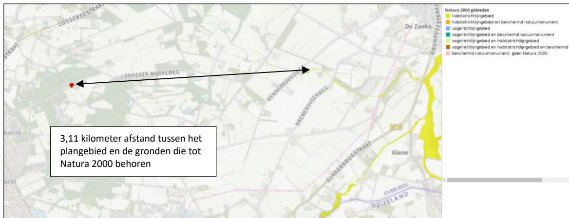
Ligging van Natura 2000-gebied in de omgeving van het plangebied. De ligging van het plangebied wordt met de rode marker aangeduid. Gronden die tot Natura 2000 behoren worden met de okergele kleur aangeduid.