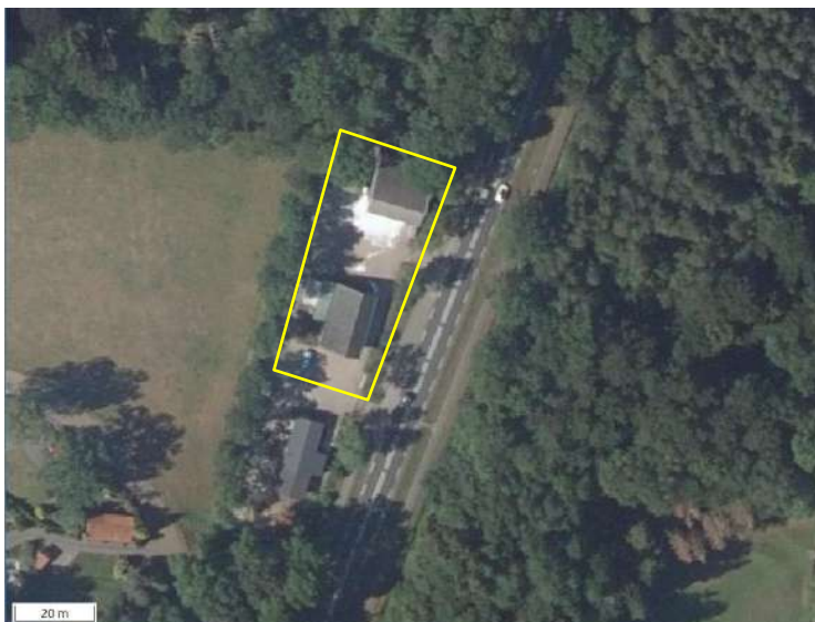
Detailopname van het plangebied. De begrenzing van het plangebied wordt met de gele lijn aangeduid.

Het plangebied bestaat volledig uit erfverharding en bebouwing. Het grenst aan de westzijde aan een houtsingel en aan de noordzijde aan loofbos. Aan de westzijde grenst het aan een verharde weg en aan de zuidzijde aan erfverharding. In het plangebied staan een aantal kapschuren en eenvoudige overkappingen. Twee kapschuren beschikken over een koude wand zij- en achtergevel, bekleed met houten betimmering (potdeksel). Alle bouwwerken zijn gedekt met golfplaten zonder dak- of wandisolatie. De gebouwen worden benut voor de opslag van strooizout en materieel voor het aanbrengen van strooizout. Op onderstaande afbeelding wordt de begrenzing van het plangebied weergegeven.