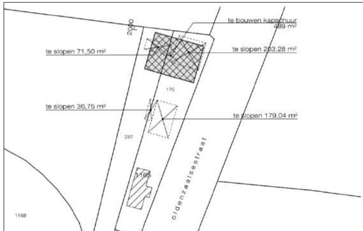
Verbeelding van het wenselijke eindbeeld (bron: Bouwkundig buro E.Meinders)

Het voornemen bestaat om vier gebouwen/bouwwerken in het plangebied te slopen en één kapschuur te bouwen aan de noordzijde van het plangebied. Op onderstaande afbeeldingen wordt de positie van de te slopen bebouwing en de vervangende nieuwbouw weergegeven.