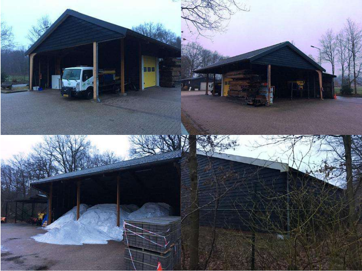
Bijlage 3. Fotobijlage. Impressie van het plangebied en de directe omgeving.