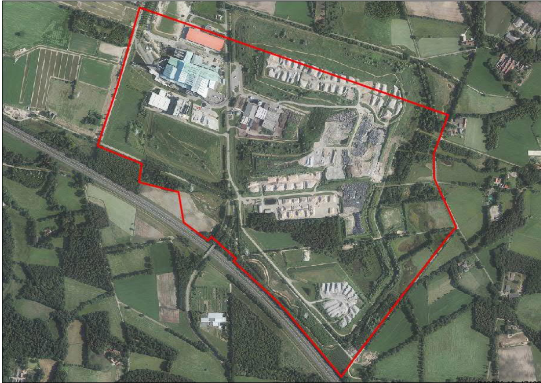
Afbeelding 2.2: Begrenzing plangebied