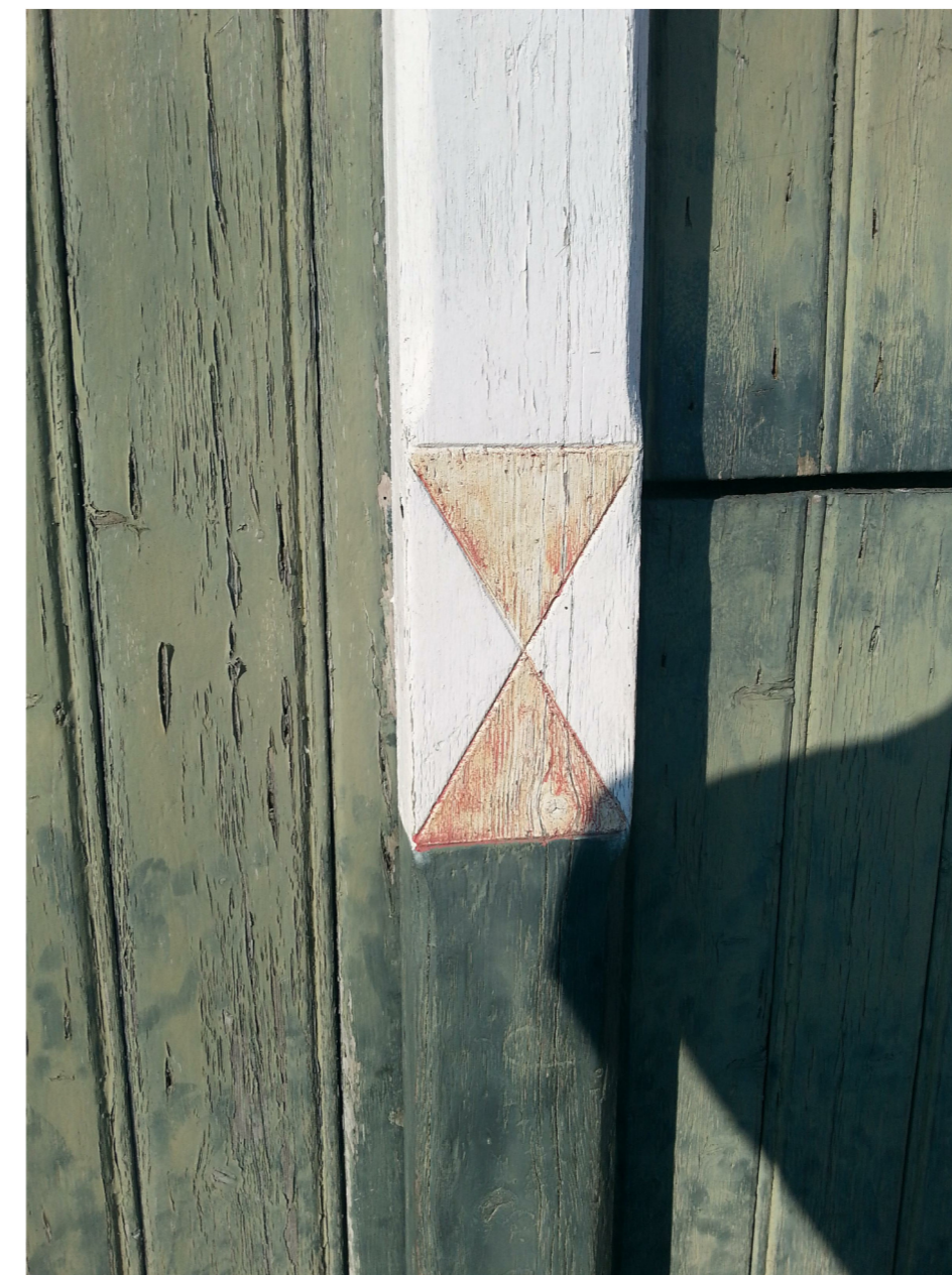
Q: Bestaand stiepelteken