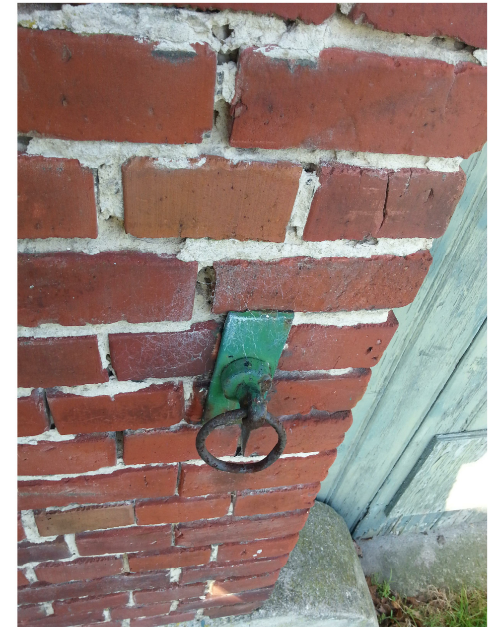
Vee- ringen in bestaande achtergevel