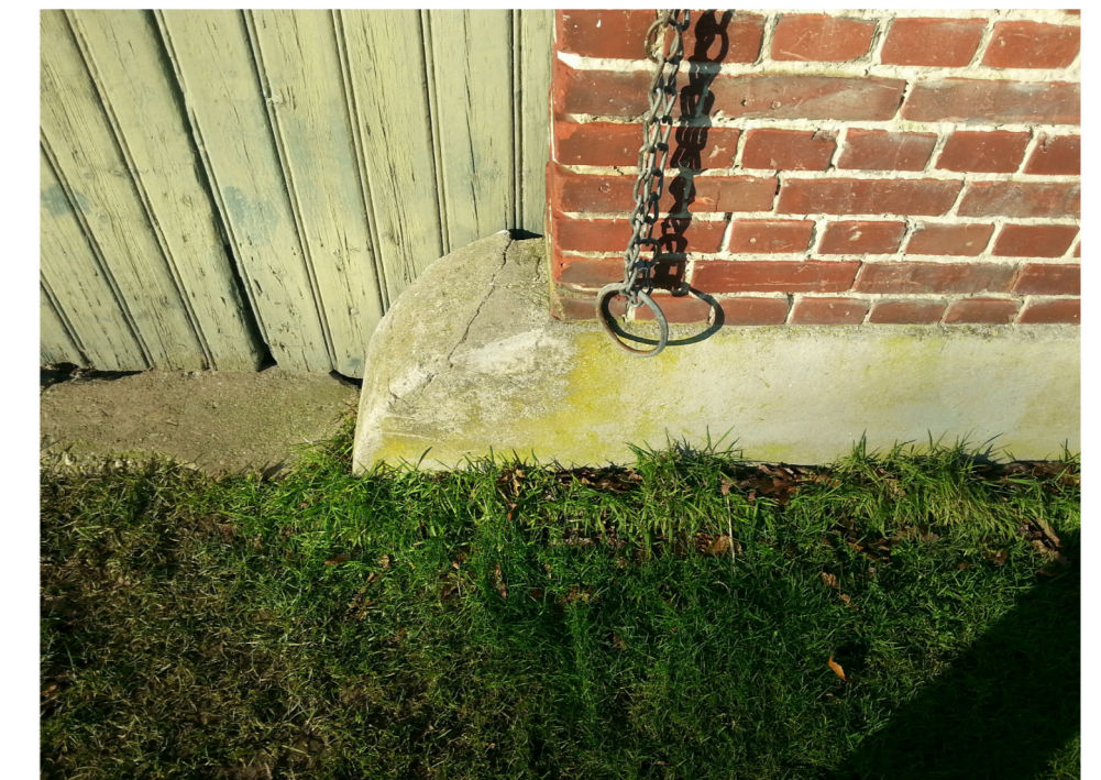
P: gemetselde en aangesmeerde schampstenen