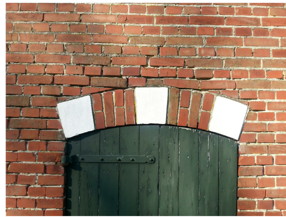
M: getoogde strekse rollaag met aangesmeerde geboorte- en sluitstenen