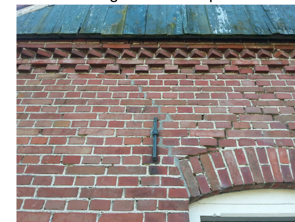
F: 4-laagse blok- en muizentand I: Balkankers als bestaand