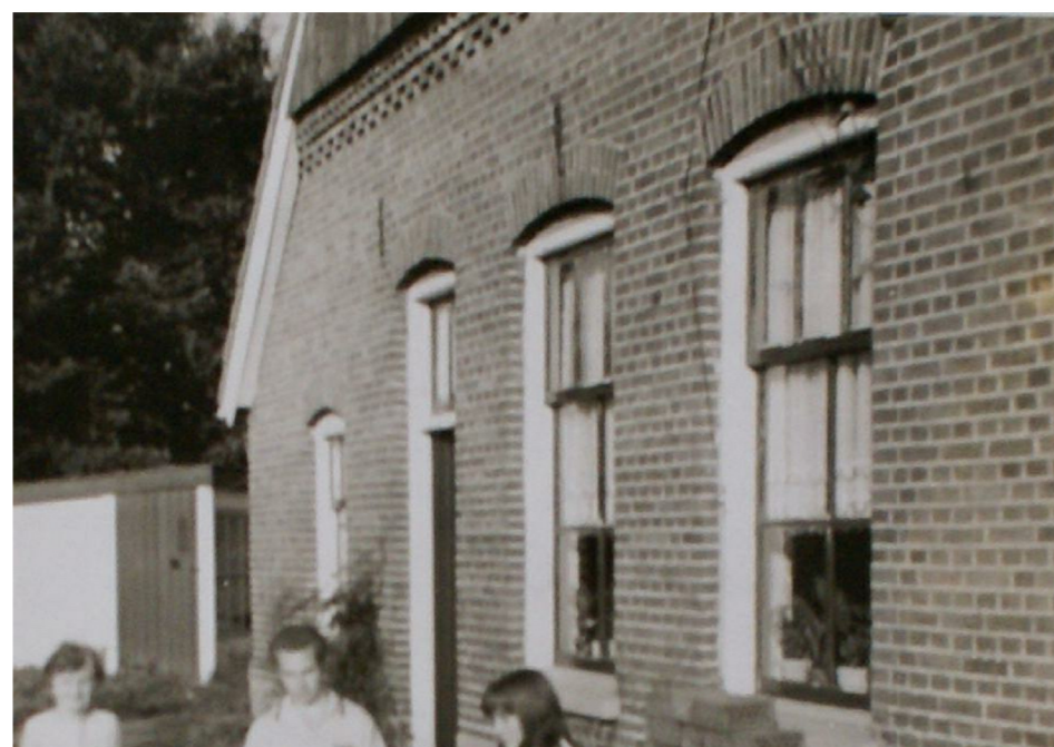
D: oorspronkelijke roede- en vakverdeling