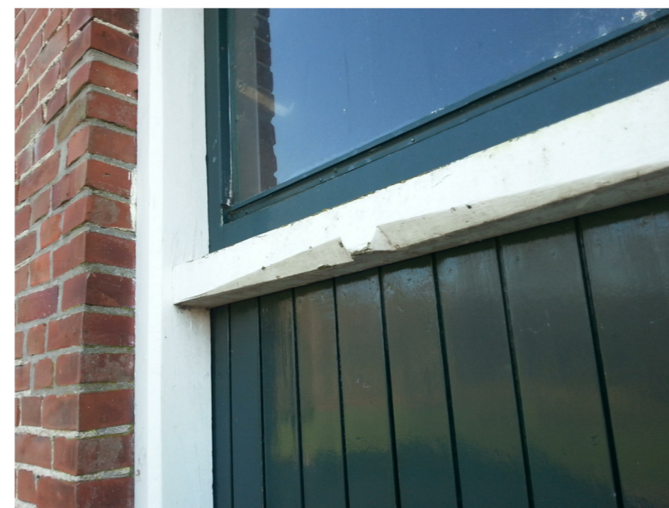
C: houtsnijwerk kozijnen voorgevel