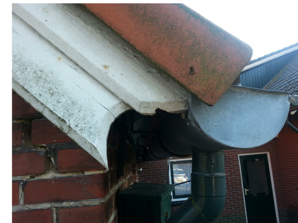
G: eenvoudige krul in boeiplank