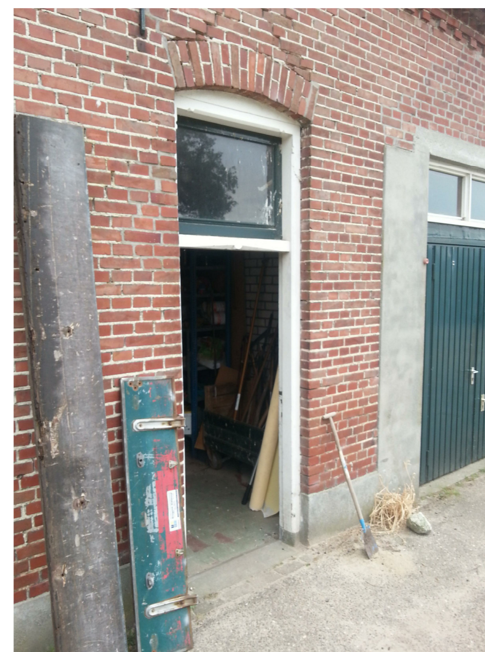
K: voordeurkozijn met cementplint