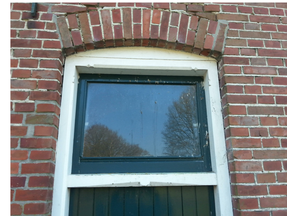
J: getoogde strekse rollaag boven kozijnen