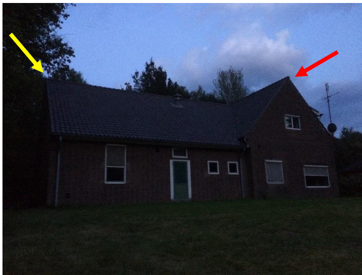
Afbeelding 4. Gebouw C25 met de nok aan de westzijde (rode pijl) en nok aan de noordzijde (gele pijl).