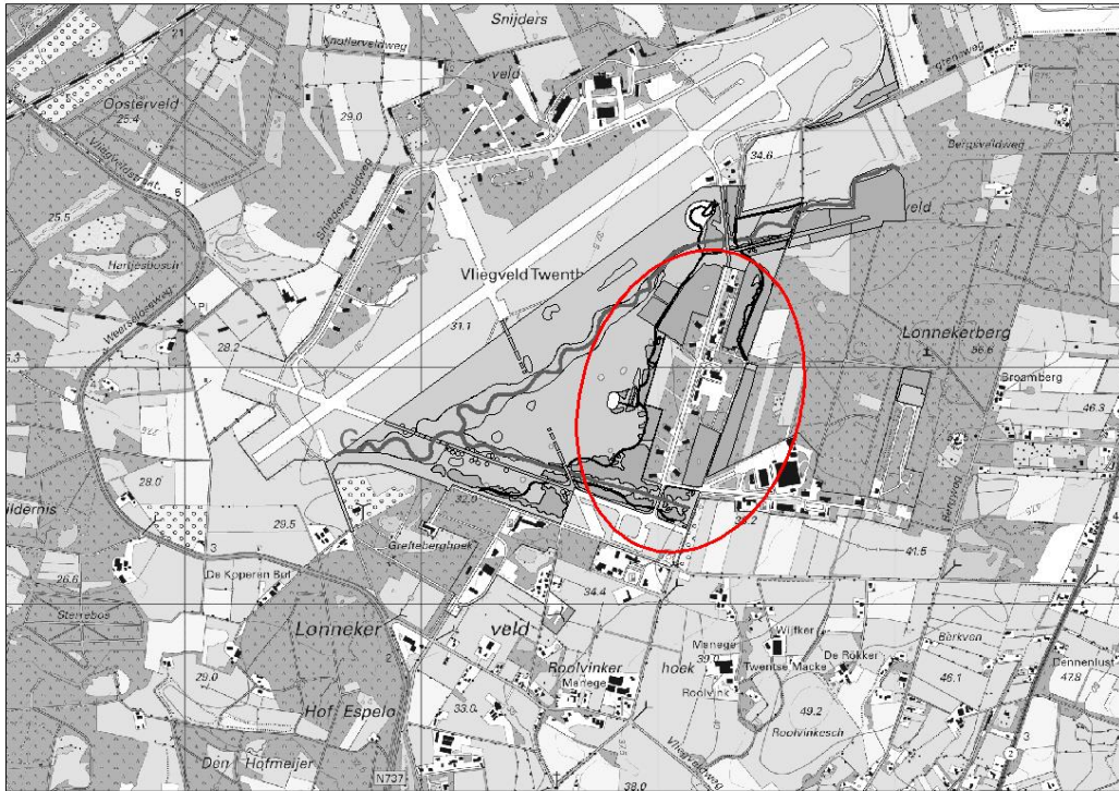
Afbeelding 1. Overzicht ligging van het evenemententerrein.

Het Airforcefestival heeft op 5 augustus 2017 plaatsgevonden op het terrein 'de Strip' onderdeel van het terrein van de evenementenlocatie Vliegveld Twenthe (www.vliegveldtwenthe.nl). Het terrein ligt ingeklemd tussen de nieuwe natuur (NNN) van het vliegveld aan de west- en noordzijde en het natuur- en bosgebied de Lonnekerberg aan de oostzijde. Ten zuiden van het festivalterrein ligt een half open agrarisch landschap (afbeelding 1).