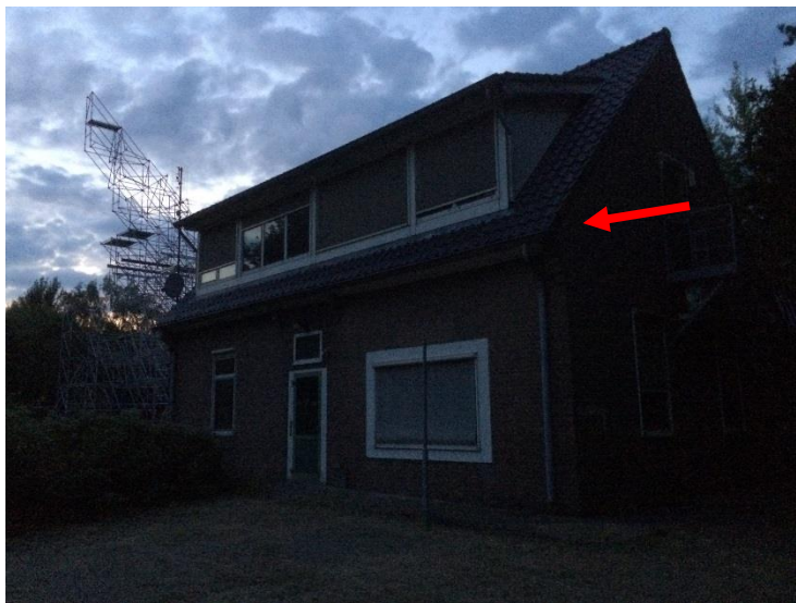
Afbeelding 5. Gebouw C23 met uitvliegopening derde pan van hoek kopgevel (rode pijl).