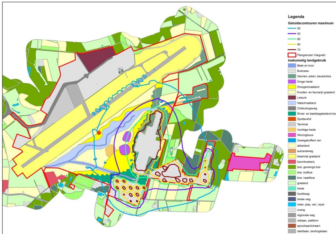
Figuur 2. Geluidscontouren van maximum variant en toekomstig landgebruik