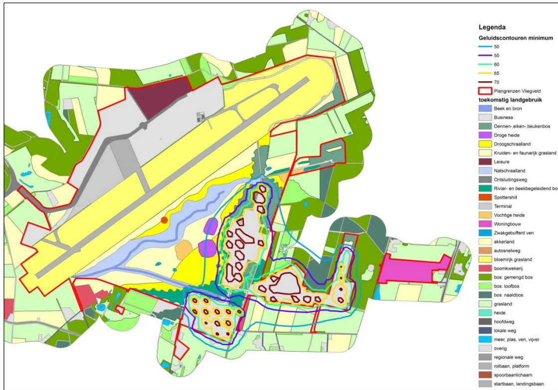
Figuur 1. Geluidscontouren van de minimum variant en toekomstig landgebruik

Voor het inschatten van de geluidsbelasting zijn twee varianten doorgerekend: een minimum en een maximumvariant. De geluidsbelasting betreft een 24-uursgemiddelde op 1,5 meter hoogte. De achtergronden voor de berekeningen zijn opgenomen in bijlage 4. De minimum-variant komt overeen met de situatie zoals gebruikt in de effectbeschrijvingen voor het MER en Sierdsema et al. (2013). De maximum-variant hoort bij een situatie met extra belastende activiteiten met een hogere frequentie. In figuur 1 en 2 zijn de verwachte geluidscontouren van beide varianten over de toekomstige inrichting van het gebied heen gelegd.