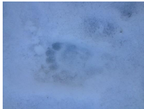
Figuur 2. Situatie bijburcht op 26 januari 2017 en spoor van das in sneeuw.