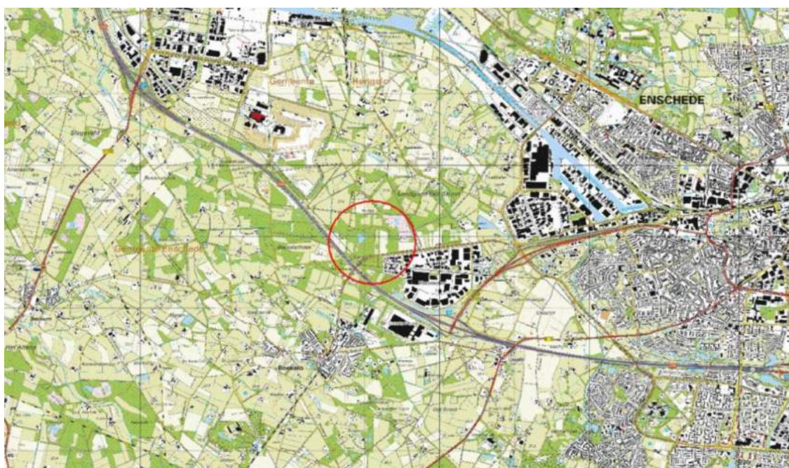
Figuur 1. Globale ligging plangebied (rood omcirkeld).

De levendbarende hagedis, die in een minder zware beschermingscategorie valt en daardoor ook minder zwaar getoetst wordt, is zijdelings meegenomen in het onderzoek.