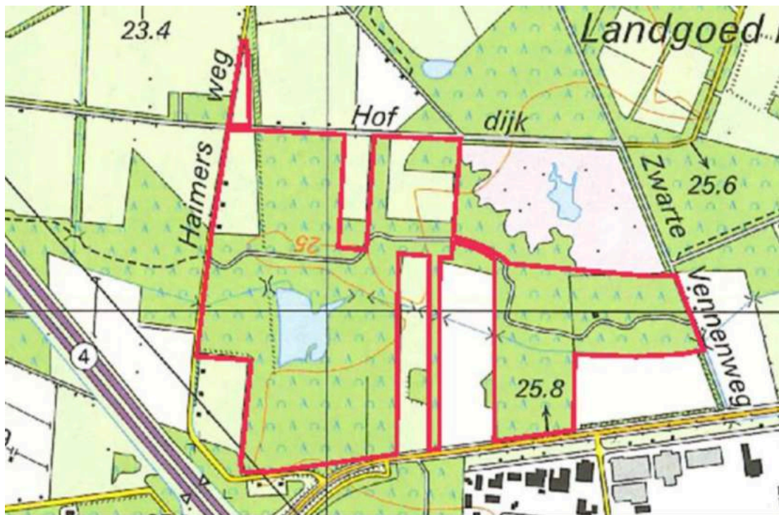
Figuur 2. Begrenzing plangebied (rood omlind) (Bron: Eelerwoude 2015; deze begrenzing is ook in 2017 nog actueel en wordt ook in het Inrichtings- en Beheerplan uit 2017 aangehouden).