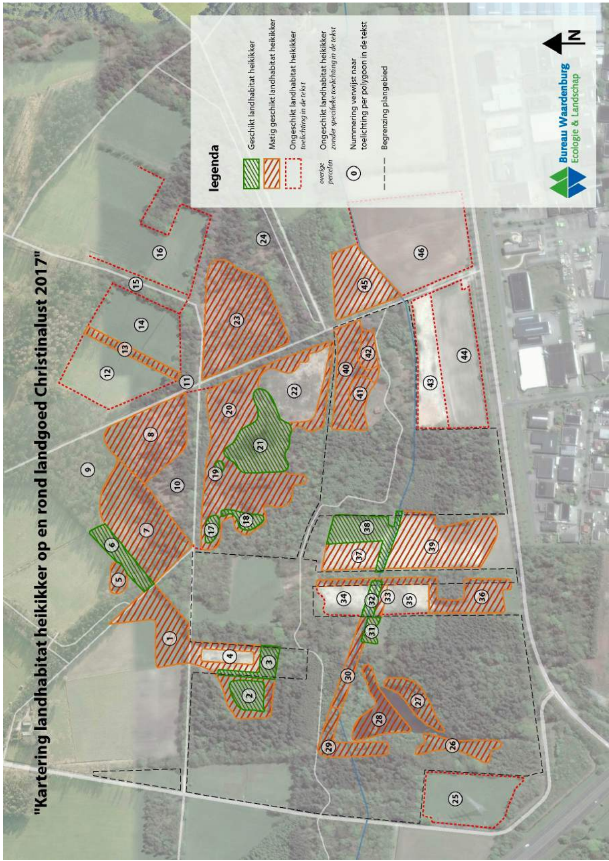
Figuur 3. Habitatkaart heikikker plangebied Christinalust.