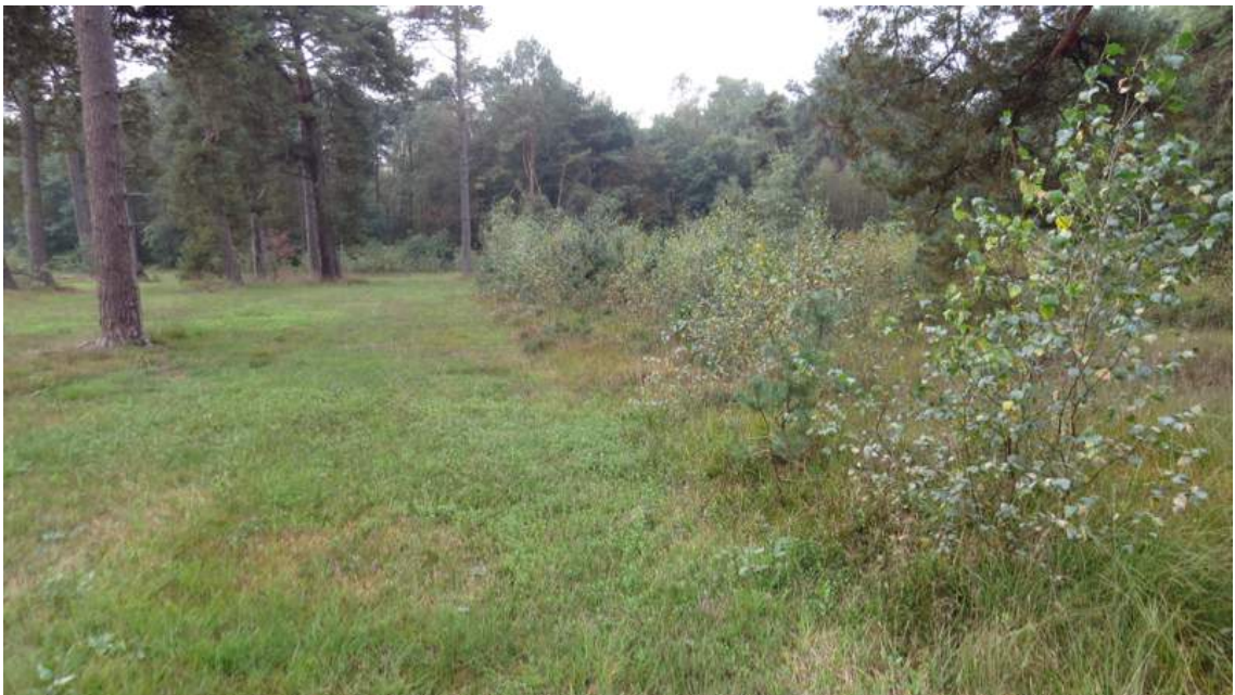
18. Geschikt – zie ook nr. 21. Op de foto is de overgang te zien van nr. 19/20 (zeer) 'matig geschikt' (linkerhelft foto: vegetatie te laag) naar 'geschikt' (rechterhelft foto) landhabitat: vochtige hoge grasvegetaties (veel dekking) met enige opslag van berk, etc. (maar nog niet teveel dichtgegroeid met struweel en daardoor voldoende zoninval). Eveneens omgeving van het Zwarte Ven (ligging buiten plangebied).