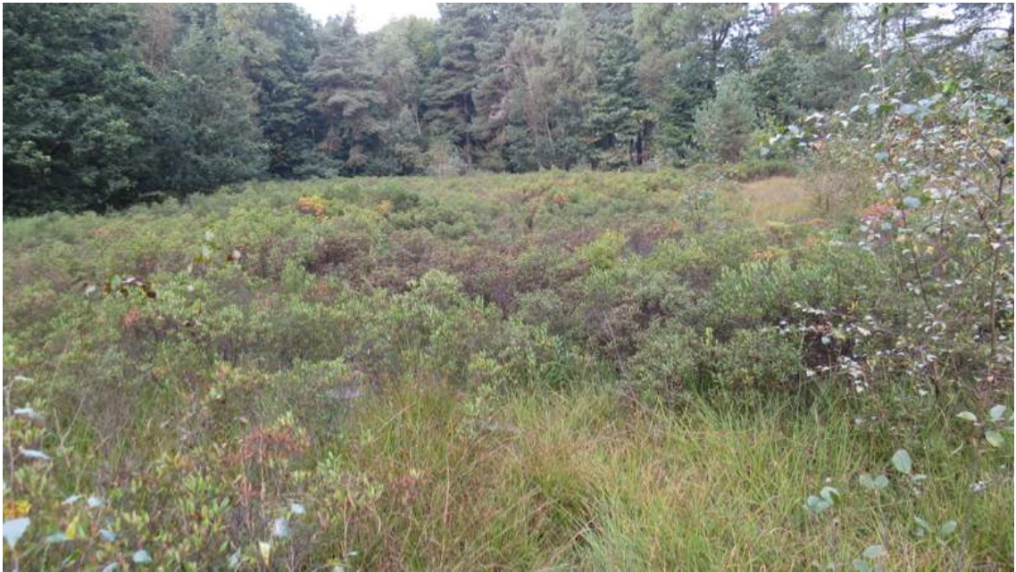
17. Geschikt – vochtig laag en open struweel (vooral wilde gage) met veel hoge grassen in de omgeving van het Zwarte Ven (ligging buiten plangebied). Optimale vochthuishouding in de grazige gedeelten. Weinig schaduwwerking door het omringende bos.